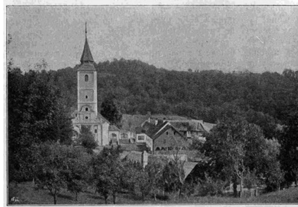
ЛЕПАВИНА, СРПСКИ ПРАВОСЛАВНИ МАНАСТИР У ХРВАТСКОЈ

Sl. 1. Lepavina, srpski pravoslavni manastir u Hrvatskoj