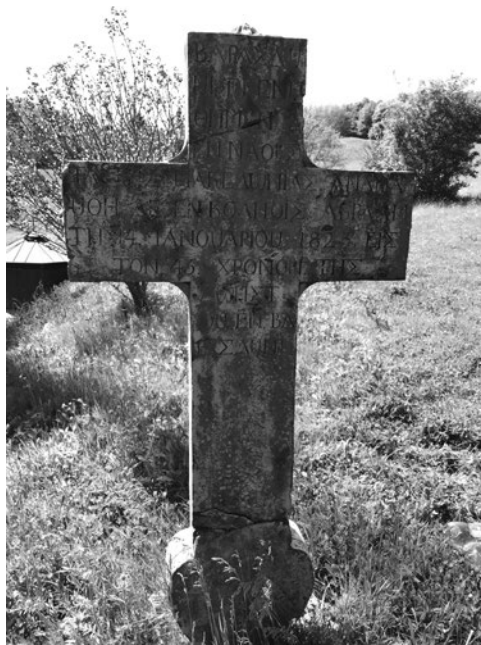
Sl. 5. Jedan od križeva na manastirskom groblju

daskama, a crkva crijepom. 25 Veliki crkveni toranj je potpuno dovršen u lipnju 1773., a hram i kruna prečiste Bogomateri nad crkvenim vratima koncem meseca septembra 1775. 26