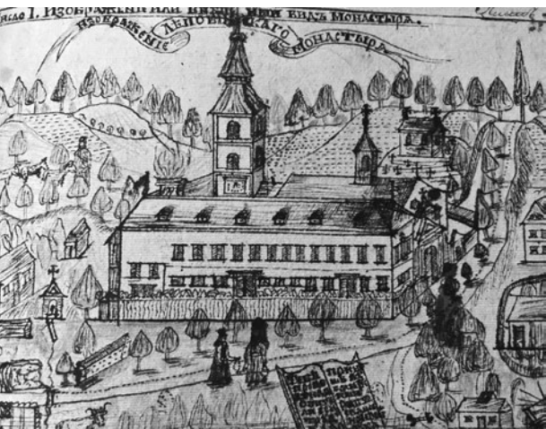
Sl. 2. Iz ljetopisa manastira Lepavina (1)