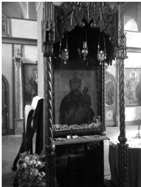
Sl. 4. Manastir Lepavina, čudotvorna ikona