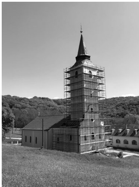
Sl. 6. Crkva manastira Lepavine danas

Novi ikonostas je crkva dobila 1775. godine, a koštao je 2375 forinti u srebru. O tome je postojao zapis na ikonostasu nad dverima unutar oltara: Ovaj hram oslika se pri državi rimskog cara, gospodina Josifa II i gospođe Marije Terezije, imperatorice rimske, i pri arhiepiscope i mitropolitu gospodinu Vičentiju Jovanoviću, pri gospodinu episkopu Atanasiju Živkoviću, pri igumanu kir Mardariju i svemu bratstvu nastojanjem gospodina Mihaila Mikašinovića, generala, izdržavanjem gospode trgovaca i spominjanjem svih pravoslavnih hrišćana, ktitora i priložnika ove svete obitelji, čija imena će biti napisana u knjizi životnoj u carstvu nebeskom u beskonačne vekove. Amin. Pisano u svetoj crkvi u hramu Vavdenja Presvete Bogorodice u opštežiteljnom manastiru našem Lepavini, leta Hristovog 1775. 21. avgusta, trudom i rukodelijem ikonopisca Jovana Grabovana Četirevića i Grigorija Popovića, njegovog učenika. 43 Taj je ikonostas stradao u bombardiranju 1943. godine, a sačuvala su se samo