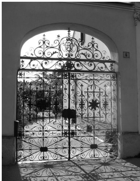
Sl. 2. Ulazna vrata u Nemčićevoj ulici br. 6 u Koprivnici, rad nepoznatog kovačkog majstora

1903. i 1904. sudjelovale su tisuće ljudi. 1 No, pod utjecajem mirotvorne politike Stjepana Radića, narod odustaje od buntovnih metoda, te se priklanja prosvjeti, unapređivanju seljačkih gospodarstava i zadrugama, a građanska škola u Virju je u tome imala znatnu ulogu, kao i Peroslav Ljubić koji je od 1892. bio urednik lista Podravec . Ljubić 1905. mijenja naziv lista u Hrvatske novine i prelazi u redove Hrvatsko-srpske koalicije. Stjepan Radić pokreće 1907. svoj list Dom , osnovavši uz pomoć podravskih seljaka i Hrvatsko-seljačku tiskaru u Zagrebu koja je osiguravala listu stalnost izlaženja, a preko knjižare u Jurišićevoj ulici koju vodi Marija Radić uspostavlja se redovita veza sa seljacima koji dolaze u Zagreb. Zbog parole braće Radić da je znanje moć, sve obitelji u Podravini teže školovanju svoje djece, pri čemu su im primarne stručne škole budući da nisu zahtije-