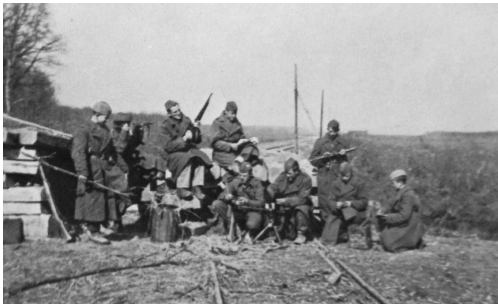
Sl. 1. Partizani na pruzi Koprivnica – Virovitica

1941., a nakon toga i u Šemovcima u siječnju 1942. prilikom napada partizana na općinsku zgradu. Kalnička partizanska grupa se u proljeće 1942. spojila s Varaždinskom, te je nova jedinica počela stvarati sve veće probleme ustaškim vlastima. Stoga je krajem travnja započela veća napadačka akcija snaga NDH koja je imala za cilj skršiti otpor partizana na tom području. Akcija je trajala desetak dana i u njoj je sudjelovalo oko 3000 domobrana, ustaša i oružnika, te je rezultirala likvidacijom vodećih partizana na Kalniku, kao i brojnim uhićenjima. Time su partizanske aktivnosti u široj okolini Podravine ugušene sve do jeseni 1942. 2