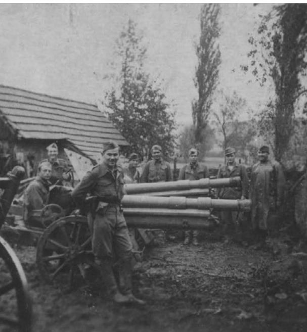
Sl. 3. U Šandrovcu – napad na Kloštar, 15. 10. 1944.