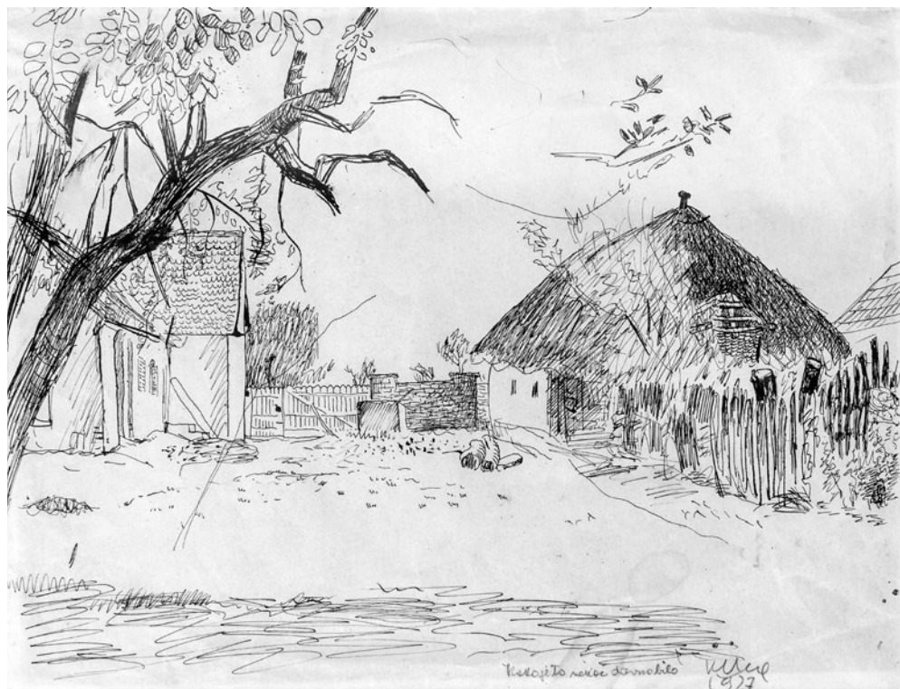
Sl. 1. Kako je to nekoć davno bilo (Kuća Hegedušićevih u Hlebinama), tuš-papir, 21x27 cm, 1927. sign. d.d. Khieg 1927.; Kako je to nekoć davno bilo (olovka, naknadno), privatno vlasništvo, Koprivnica

značene su, dakako i relacije koje su rad ovoga umjetničkog udruženja vezivale uz pojedine zemljopisno-duhovne komplekse. U tom smislu i Podravina se spominje kao jedan od najvažnijih motivskih izvorišta za zemljaška ostvarenja, kao kraj iz kojega su potekli neki od njegovih članova i, svakako, kao ambijent u kome je nastao jedan od sadržajnih sastavnica Zemlje – fenomen naivnog slikarstva. No, bez obzira je li riječ o znanstveno-kritičkim doprinosima, esejističkim varijacijama, novinskim analizama, memoarsko-dnevničkoj literaturi ili dokumentarnim prilozima rijetko se o toj povezanosti razmišljalo kao o jednoj vrsti imanencije, u kojoj veze, uzroci i posljedice nisu skup nekih slučajnih okolnosti nego proizlaze iz složenih, međusobno povezanih i uvjetovanih činjenica. Zbir svih tih pojedinsti može, naime, rezultirati stanjem i slikom koja je jednostavna kvantifikacija, ali i stanjem koje pokazuje dublje rezultate uzročno-posljedičnih veza.