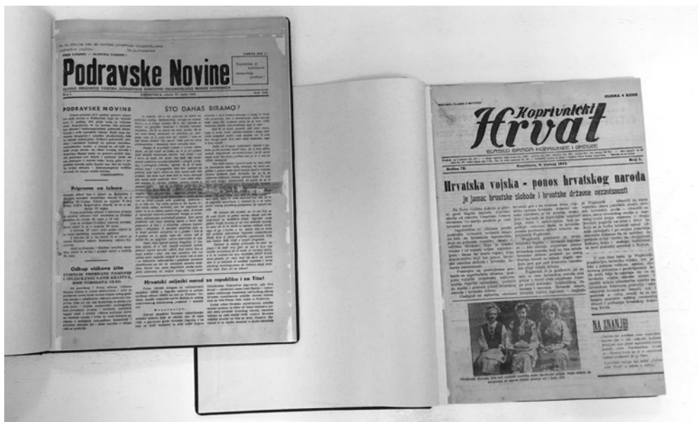
Sl. 1. Originalni, restaurirani fizički primjerci starih koprivničkih novina

nika 11 . Te su novine svjedok života u Koprivnici i okolici i izvor informacija o događajima početka prve polovice 20. stoljeća i kao takve su vrijedan i često nezamjenjiv izvor u istraživanju lokalne povijesti i kulture. Njihovo očuvanje preventivnim mjerama zaštite je problematično zbog svojstava papira na kojem su tiskane 12 , pa stoga nije neobično da je temeljitim uvidom u stanje fonda muzejske knjižnice krajem 1990-ih zaključeno da su stare koprivničke novine i časopisi, pri čemu se starim novinama i časopisima smatra publikacije koje su izlazile do 1945. godine, u posebno lošem stanju 13 i preventivna zaštita nije dovoljna kako bi ih se spasilo od propadanja. Kako bi novine ostale trajno sačuvane i fizički