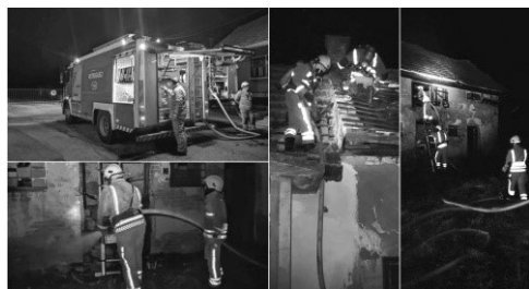
Sl. 8. DVD Ludbreg i nakon 150 godina predstavlja oslonac sigurnosti stanovnika Grada Ludbrega i ludbreške regije

Ludbregu, kada su svojim nastupom jako razveselili carevog zeta princa Leopolda Salvatora, uz sjajnu bakljadu priredenu od strane članova ludbreškog vatrogasnog društva.