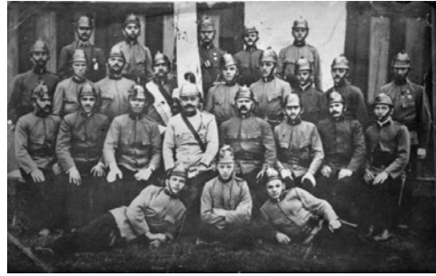
Sl. 2. Operativna postrojba DVD-a Ludbreg početkom 20. stoljeća

Najstrašniji požar na području ludbreške regije u 19. stoljeću zabilježen je u Ludbregu. Na sam blagdan Tijelova, 29. svibnja 1864. godine, tijelovska se procesija kretala ulicama grada, dok su mladići u više domaćinstava tradicionalno ispaljivali plotune iz mužara. Iskra iz jednog od mužara zapaljenih u blizini crkve odletjela je do svinjca pokrivenog slamom i inicirala požar u kojem je izgorio dio župnog dvora s velikim dijelom župnog arhiva (da nije bilo tog požara danas bi vjerojatno više znali o prošlosti grada), zatim šezdesetak kuća u centru grada, a potom i krov jedne od zgrada ludbreškoga starog grada (vjerojatno zgrada u kojoj je danas sjedište gradske vlasti) 1 . Slavlje blagdana zamijenili su očaj i tuga te tako postavili temelj za iskorak lokalne zajednice – osnivanje vlastite vatrogasne organizacije. Već nekoliko godina nakon tog strašnog požara, po uzoru na nedaleki Varaždin, osnovan je Ludbreški vatrogasni zbor. Njegova registracija trajala je čak nekoliko godina, pri čemu su društvena Pravila verificirana od strane Kraljevske hrvatsko-slavonsko-dalmatinske zemaljske vlade u Zagrebu tek 1876. godine, no njegov službeni datum osnutka je 15. kolovoza 1869. godine. Naime, načelnik općine Đuro Šafarić tog je datuma održao osnivačku skupštinu zajedno sa zainteresiranim građanima te u rad zbora odmah uključio predstavnike svih staleža odnosno