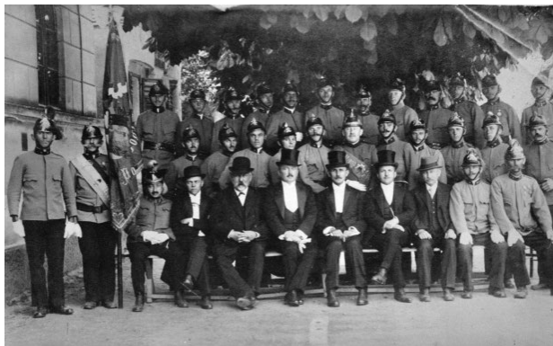
Sl. 4. Članovi DVD-a Ludbreg s cijelom gradskom upravom 1921. godine