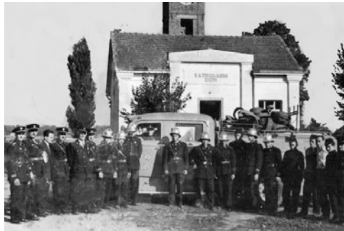
Sl. 6. Članovi DVD-a Ludbreg uz prvu autocisternu nabavljenu 1965. godine (ispred drugog vatrogasnog doma koji se nalazio uz obalu Bednje)

Dne 6. t. mj. oko 1 sat poslje podne porodila se je vatra u štaglju Gjure Raplinovića u Bolfanu, te je izgorjeo štagalj vriedan 100 for., 2 kotca 20