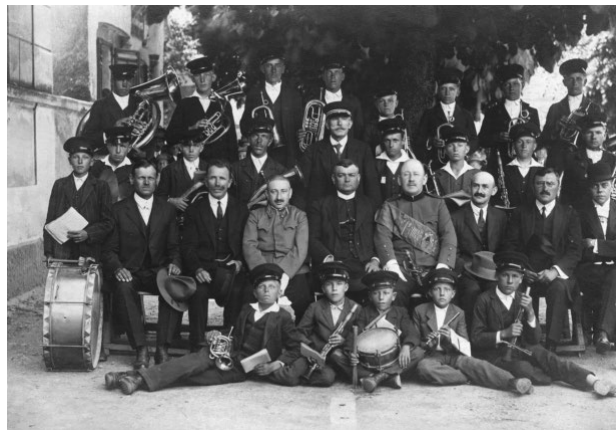
Sl. 3. Limena glazba DVD-a Ludbreg na početku 20. stoljeća