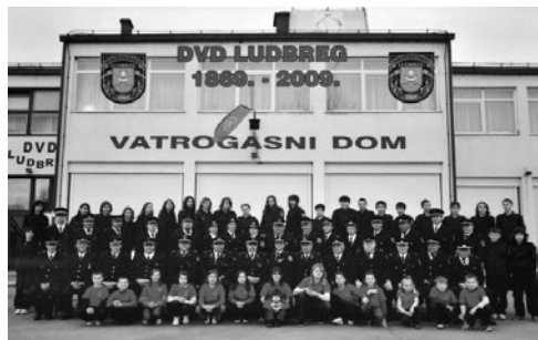
Sl. 7. Članstvo DVD-a Ludbreg fotografirano pred sadašnjim vatrogasnim domom 2009. godine prigodom obilježavanja 140. obljetnice osnutka