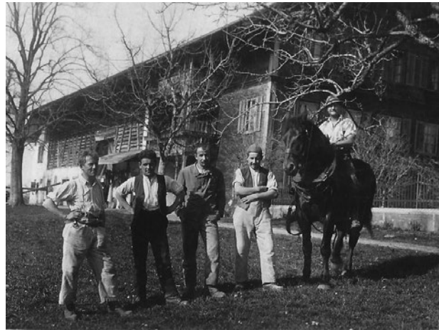
Sl. 5. Poljoprivredni praktikanti na poljoprivrednom posjedu u Švicarskoj

Nakon uzorno organizirane i provedene poljoprivredne prakse u Švicarskoj, prvih 86 praktikanata iz Jugoslavije se do kraja 1930. godine vratilo svojim kućama. Povratkom na svoja domaćinstva praktikanti su bili puni impresija i novih znanja. Bilo im je jasno da je Sve-