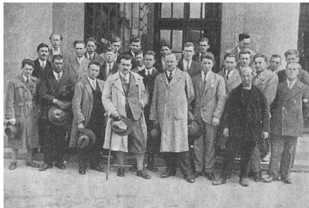
Sl. 1. Prva grupa poljoprivrednih praktikanata pred put u Švicarsku

Odvijanje poljoprivredne prakse moguće je pratiti slijedom: osobnih dnevnika praktikanata, pisama praktikanata Zavodu i uvidom u Upitne arke za poslodavce koje su praktikanti bili dužni ispuniti. Taj je Upitni arak također bio vrlo iscrpan; sadržavao je 50 pitanja na koje je trebalo odgovoriti. U nekoliko opisa, natuknica, nastojat ću izdvojiti neka bitna događanja s prakse naših mladih poljoprivred-