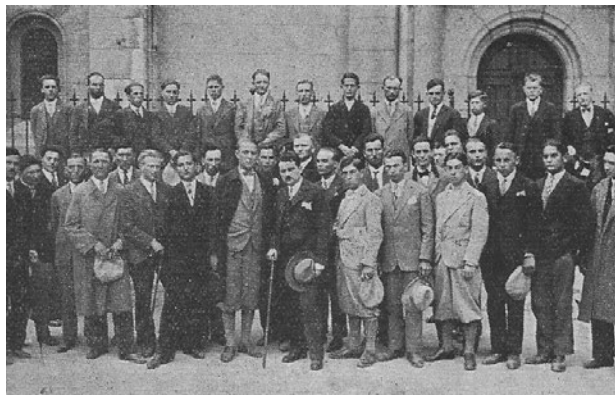
Sl. 2. Druga grupa poljoprivrednih praktikanata pred put u Švicarsku

nika. Prva nelagoda i prava bojazan pojavili su se odmah nakon što se grupa »raspala« i pojedinci ostali sami sa sobom, u nepoznatom svijetu, uglavnom oskudno poznavajući jezik, među nepoznatim ljudima, ne znajući što im predstoji! U većini slučajeva sve je dobro prošlo, zahvaljujući neočekivanoj prisnosti domaćina i želji da se svaki praktikant osjeća kao član domaćinove obitelji. Razgovorno se domaćin titulirao kao poslodavac ili kao gospodar , a brojni su primjeri izražene pohvale od strane praktikanata gdje su ih smatrali učiteljima i prijateljima. Redovita praksa bila je da su pri poslu, ali i za vrijeme obroka svi ravnopravni, da rade svi zajedno i jedu za istim stolom bez obzira je li riječ o domaćinu, domaćici, praktikantu ili slugi.