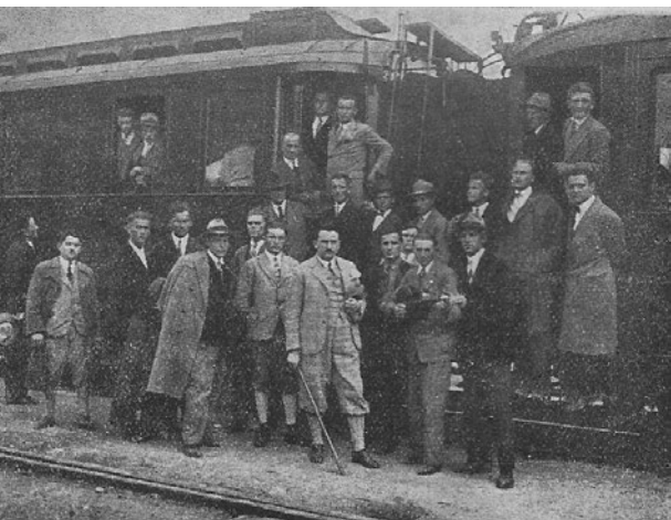
Sl. 3. Treća grupa poljoprivrednih praktikanata pred put u Švicarsku