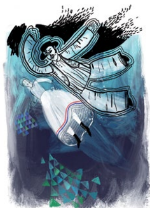
Dragutin Feletar ZEBRANI VERSI Drage popevke zmetane na kup

Zebrani versi : drage popevke zmetane na kup / Dragutin Feletar : [ilustracije Danilo Dučak]. – Samobor : Meridijani ; Koprivnica : Društvo hrvatskih književnika, Podravsko-prihorski ogranak, 2018. – 135 str. : ilustr. u bojama ; 21 cm. – (Biblioteka Hrvatski pisci i umjetnici ; knj. 32)