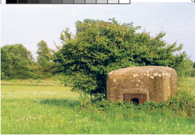
Sl. 1. Karakteristični bunker s rijetkim detaljem čeličnog ojačanja otvora puškarnice.

snije, zbog razvoja europske političke i ratne situacije (1938. godine njemačko pripojenje Austrije, 1939. godine okupacija Češke i napad na Poljsku), utvrđivanje se širi na područje graničnih frontova prema Austriji (tada dio nacističke Njemačke), Mađarskoj i Albaniji, a 1940. godine i prema Bugarskoj i Rumunjskoj. Kao kuriozitet vrijedno je spomenuti da je 1939. godine na utvrđivanju radilo 30.000 ljudi, a 1940. godine njih čak 60.000! Naš centar interesa, bunker u okolici Koprivnice, dio su granične fronte prema Mađarskoj koja je obuhvaćala protutenkovske rovove, dvije linije bunkera i zapreka na komunikacijama na potezu Varaždin – Koprivnica – Virovitica – Slatina. Fortifikacijski objekti građeni su kao armirano-betonski puškomitraljeski i mitraljeski bunker, a zbog sasvim različitih koncepcija ratovanja, tipološki ne slični niti „Magino“ liniji niti češkim bunkerima (koje su gradili isti francuski inženjeri): malog su mjerila, s jednim otvorom za strojnicu i prostorom za posadu od 2 do 3 čovjeka. Nisu, za razliku od francuskih i čehoslovačkih primjera, činili obrambenu kombinaciju teških artiljerijskih i laganih mitraljeskih bunkera, već su služili samo kao puško-mitraljeska obrana glavnih cestovnih i željezničkih smjerova te graničnog prijelaza s Mađarskom (u to vrijeme njemačkom saveznicom). Bunker su smješteni u gradu Koprivnici (kao važnom cestovnom i željezničkom križanju) te u okolici, uz glavne cestovne i željezničke komunikacije.