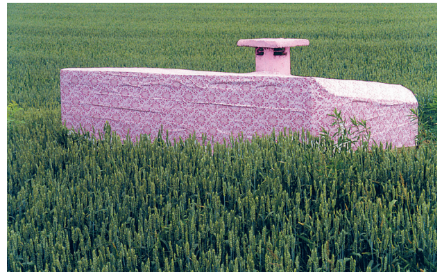
Sl. 2. Bunker kod Đelekovca, jedan od bunkera oblijepljen tapetama tijekom 1999. godine (snimio: A. Grgić).

storijom za posadu. U oba slučaja građevine se sastoje od pravokutnog ulaznog hodnika širine i duljine od 1 m na koji se nastavlja pravokutna/peterokutna prostorija za posadu 2 x 2 m, visine stropa 2,2 m. Ukopani su u zemlju od 1 do 1,5 m, a kod pravokutnih bunkera na kosom krovu nalazi se ventilacijski otvor u obliku dimnjaka (stručno rečeno – vjetreni odvod). Kod peterokutnih bunkera vjetreni odvod je riješen kružnom rupom promjera oko 7 cm u sredini blago kupolastog krova, a za razliku od pravokutnih koji posjeduju samo jednu, ovi su opremljeni s dvije puškarnice. U prvu gore navedenu skupinu pravokutnih bunkera spadaju bunker u gradu Koprivnici, selima Đelekovec i Vlajslav, a drugu skupinu čine bunker kod granične željezničke postaje Botovo i kod odvodnog kanala u Molvama. Postoje i primjeri drugačijih oblika, npr. longitudinalnog oblika s ekstremno produženim ulaznim hodnikom kod željezničke postaje Botovo.