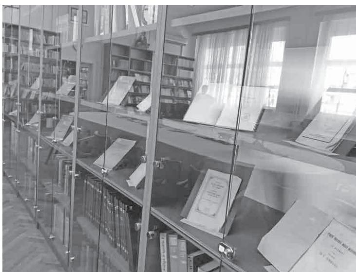
Slika 1. Izložbene police