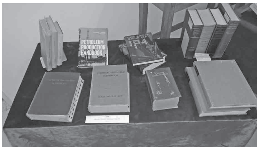
Slika 3. Kemijsko i kemijsko-inženjerski priručnici

Prisjećamo se sada pomalo nostalgично izložbe u staroj zgradi u Teslovoj ulici jer je nedugo nakon 55. obljetnice i otvaranja izložbe Fakultet preselio na Kampus. Dočekalo nas je puno novih stvari, no promjene su neminovne, a bez knjiga i knjižnica bilo bi neizvedivo prevladati jaz između prošlosti i sadašnjosti. Time „Ex libris KTF“, prateći značajnu obljetnicu Fakulteta, svojom simbolikom i stvarnom porukom predstavlja zalag za budućnost.