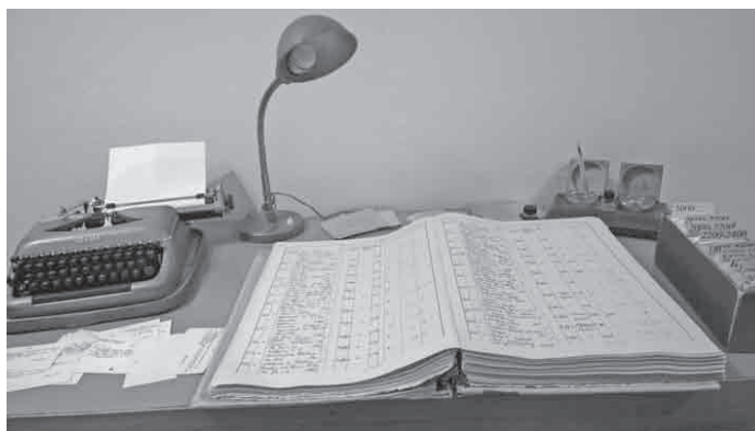
Slika 1. Radni stol knjižničara prije procvata informatičkih znanosti i tehnologija