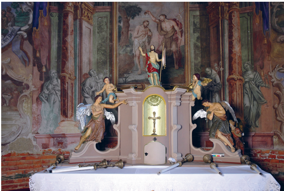
Sl. 1. Tabernakul glavnog oltara u crkvi sv. Ivana Krstitelja prije radova.