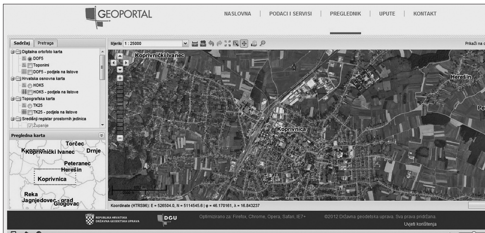
Sl. 1. Preglednik GEOPORTAL DGU.