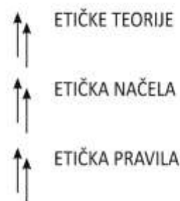
Slika 1. Etičke prosudbe

je osnova morala. Dok pitanje morala glasi ŠTO TREBA ČINITI?, etičko pitanje traži odgovor na pitanje ZAŠTO TREBAM ČINITI TO ŠTO TREBAM ČINITI? Etika pokušava odgovoriti na pitanje zašto treba činiti dobro i po čemu je dobro doista dobro - ona je filozofska refleksija moralnosti ljudskog djelovanja. Činjenje dobrog a izbjegavanje činjenja zla etičko je načelo, osnovno pravilo (uputa, mjerilo, naputak, obrazac, točan popis) ponašanja a u sklopu neke etičke teorije u društvenom ponašanju. U donošenju etičkog suda, odluke ili zaključka ("etičke prosudbe") sva tri spomenuta elementa (pravila, načela, teorije) su povezana i da na prosudbu imaju stanovit utjecaj. To možemo prikazati grafički na način kako je učinjeno na slici 1. U ovom je grafičkom prikazu /25/ kao što se vidi, zastupljena induktivna metoda koja polazi od pojedinačnog (pravila) i ide ka uopćavanju (teoriji). Međutim, u etičkom prosuđivanju moguć je i obrnuti put (deduktivna metoda), da se prosudba temelji na nekoj etičkoj teoriji (deontološkoj, militarističkoj, egzistencijalističkoj, stoičkoj itd.) i preko određenog etičkog načela vodi ka konkretnom etičkom pravilu (na primjer, ne kažnjavaj učenika).