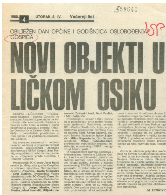
Slika 1. Prikaz jednog isječka u Hemerotecij 9

novina (ponegdje i rukopis) te su rukom napisane oznake (npr. UP, DRUM, F i dr.). Na većem broju isječaka pojavljuje se otisnuti broj, za koji se može pretpostaviti da je služio u svrhu numeracije ili jednoznačnog označivanja materijala unutar zbirke. Kako su novinski isječci različitih veličina, u starijem dijelu zbirke su radi lakše fizičke manipulacije lijepljeni na papir veličine A4, ponegdje i više njih, a od 90-ih godina to više nije bio slučaj. Povijest zbirke (promjene imatelja, prikupljanje, korištenje i sređivanje gradiva, digitalizacija i dr.) ostavila je fizički trag u sačuvanim isječcima kao što su oštećeni rubovi, zgužvani papir i slična oštećenja.