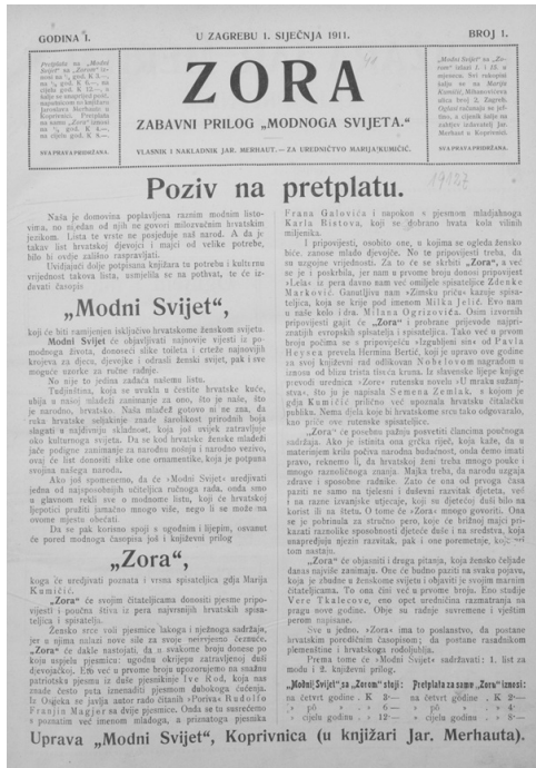
Sl.2. Zora, prilog Modnog svijeta., 01.01.1911., br.1 (Nacionalna i sveučilišna knjižnica).

Modni svijet i Zora , usprkos svom lijepom izgledu i poučnom štvu, nažalost nisu bili dugog vijeka. Izašlo je svega 11 brojeva pa je list prestao s izlaženjem već u lipnju iste godine. Je li Modni svijet ugrozila Parizka moda 12 ili financijske nedaće, trenutnačno ostaje nejasno.