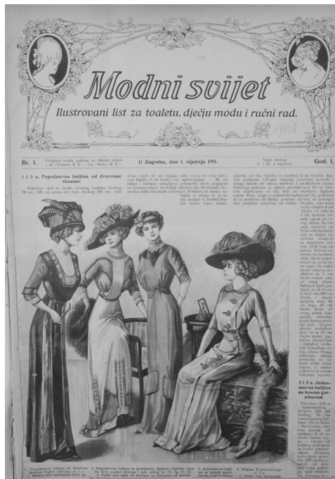
Sl.1. Modni svijet, 01.01.1911., br.1.

Namjera izdavatelja je ponuditi hrvatskim ženama list koji će objavljivati najnovije vijesti iz pomodnog života , bogato ilustriran slikama i crtežima najnovijih krojeva, i to ne samo za žene, već i za djecu i djevojke. Iz podnaslova je vidljivo – osim mode, na stranicama časopisa rezervirano je mjesto i za ručni rad. Uz upoznavanja žena s modnim novitetima, časopis je nametnuo još jednu zadaću da se kod hrvatske ženske mladežijače podigne zanimanje za narodnu nošnju i narodno vezivo . Stoga će časopis donositi slike