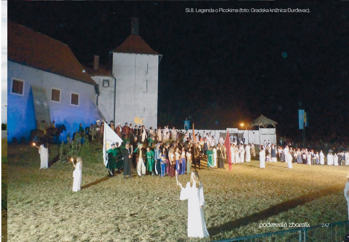
Sl.8. Legenda o Picokima.