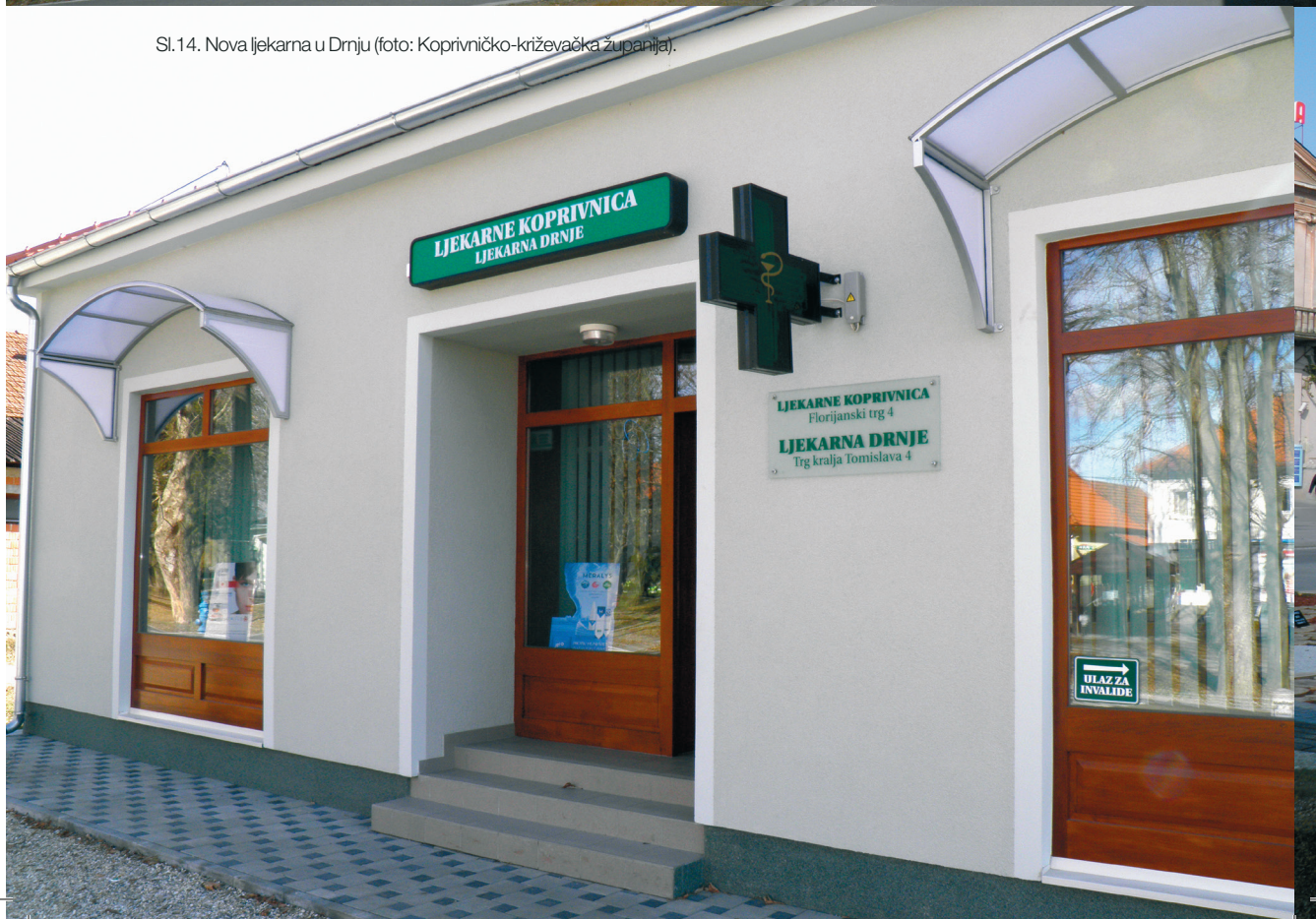
Sl.14. Nova ljekarna u Drnju.