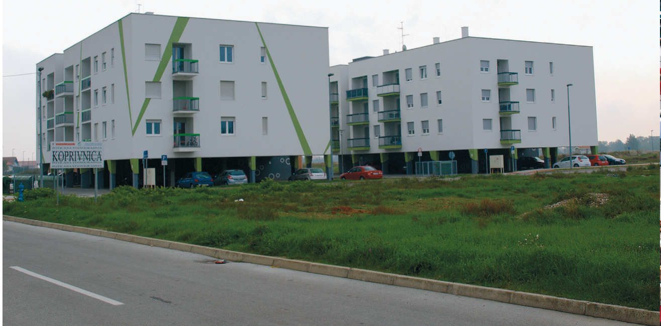
Sl.1. Špame hiže u Koprivnici.