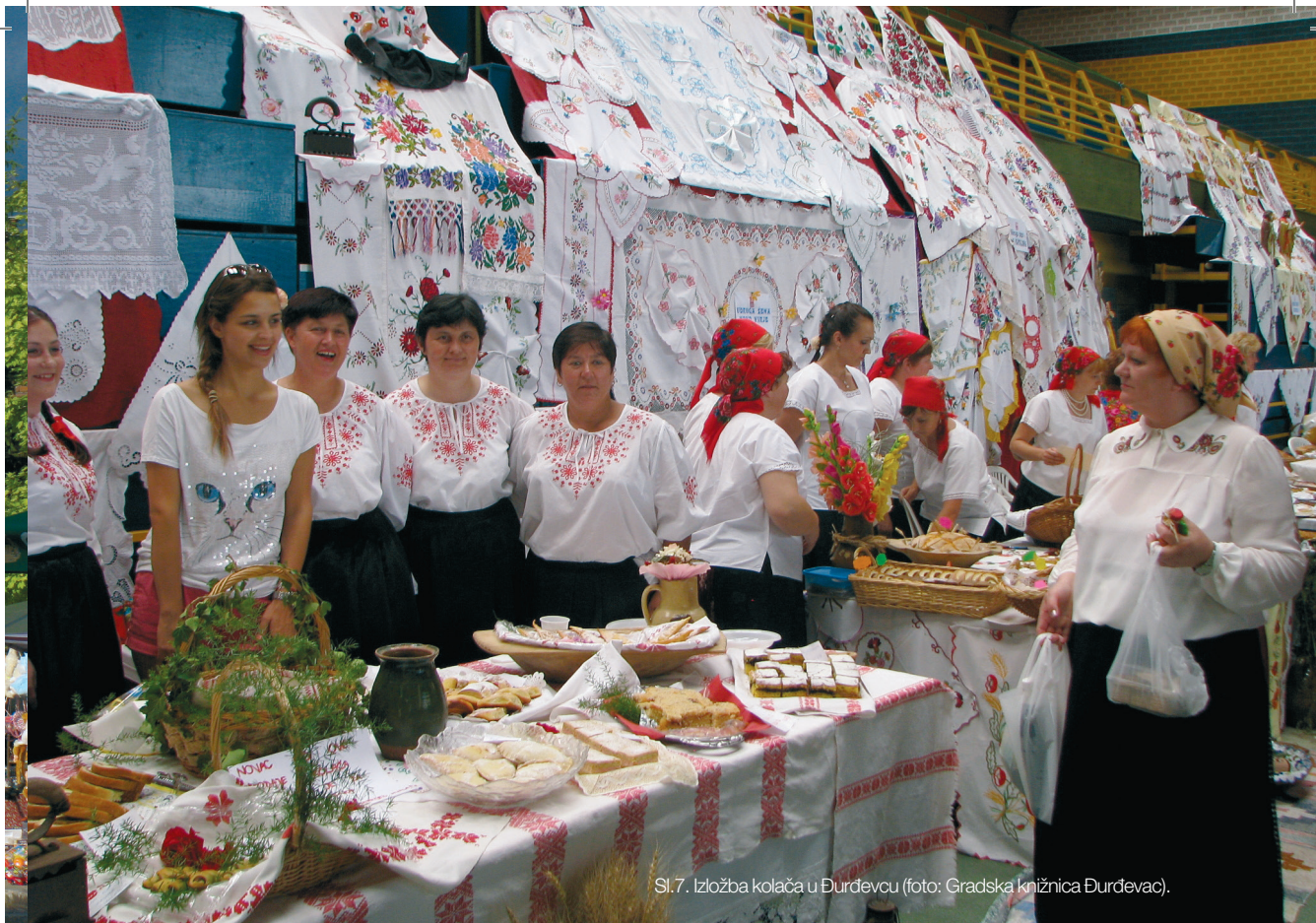
Sl.7. Izložba kolača u Đurđevcu.