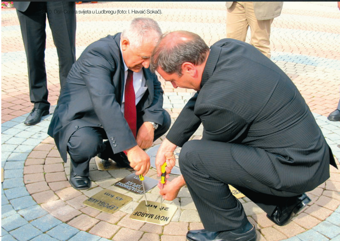
Sl.10. Dan Centra svijeta u Ludbregu.