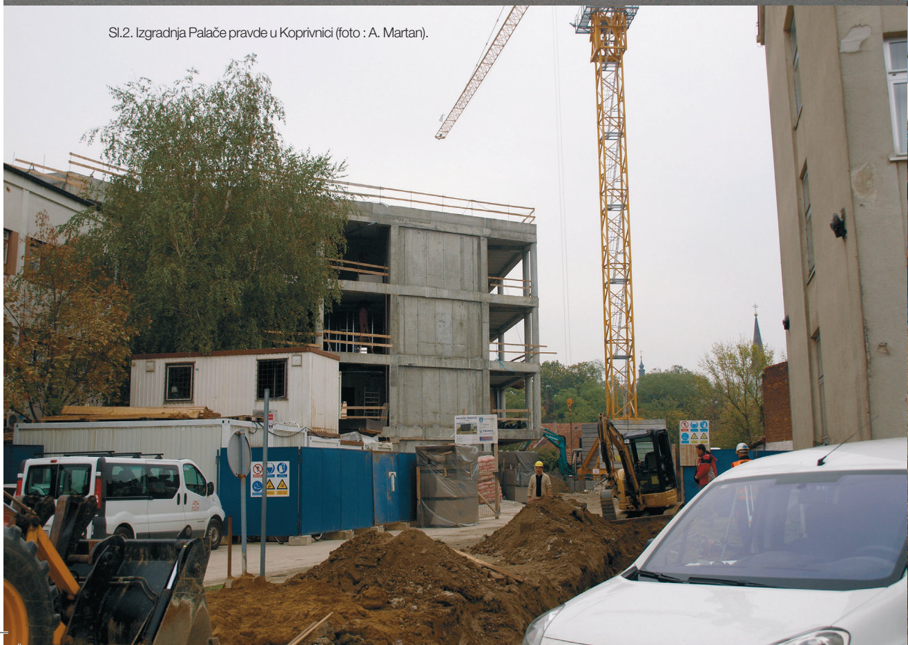
Sl.2. Izgradnja Palače pravde u Koprivnici.