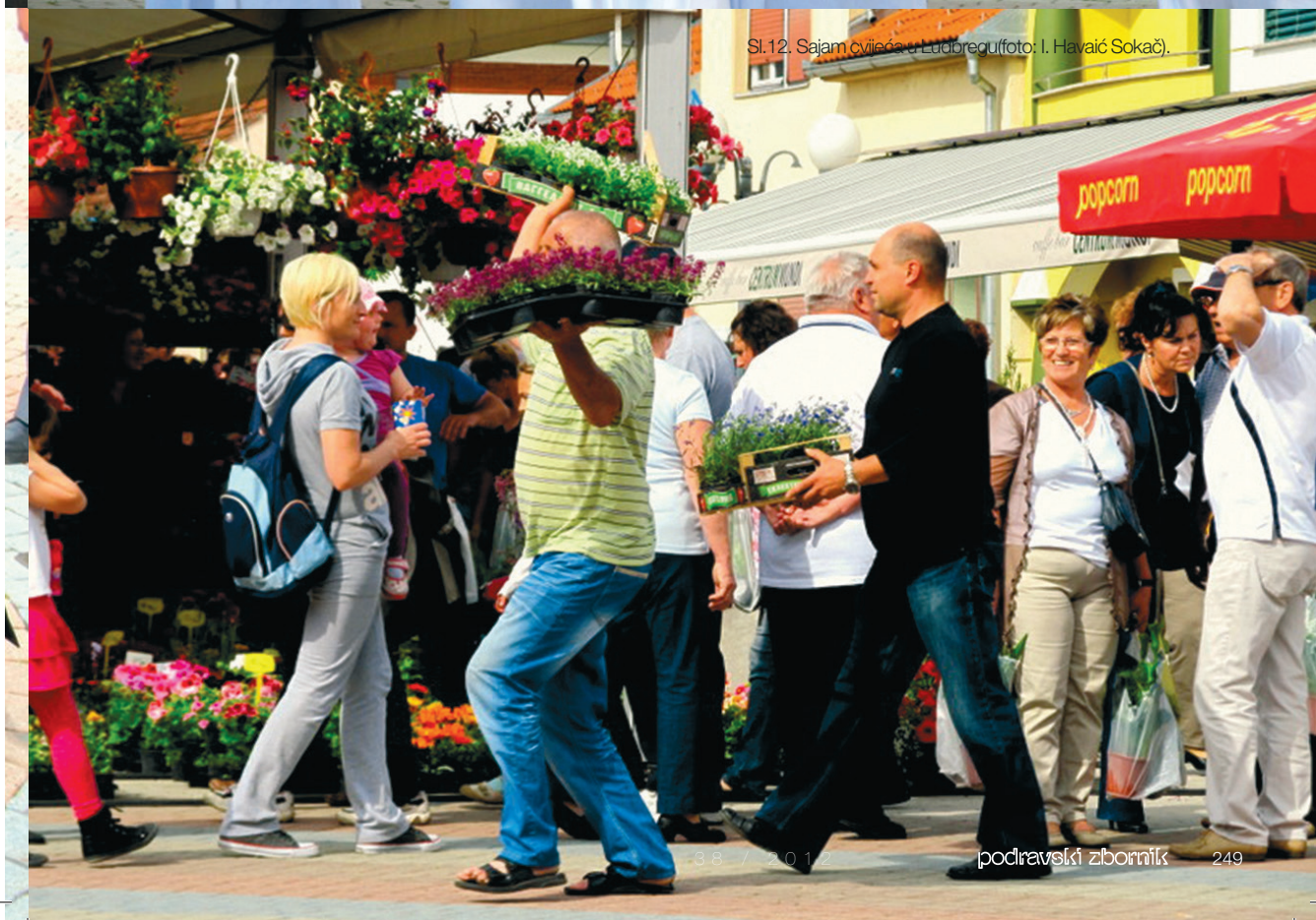
Sl.12. Sajam cvrčica u Ludbregu.