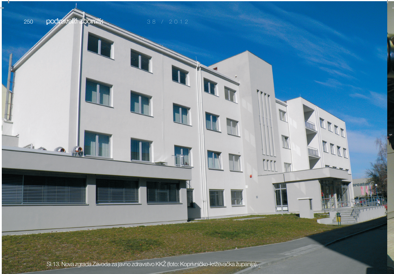
Sl.13. Nova zgrada Zavoda za javno zdravstvo KKŽ (foto: Koprivničko-križevačka županija).