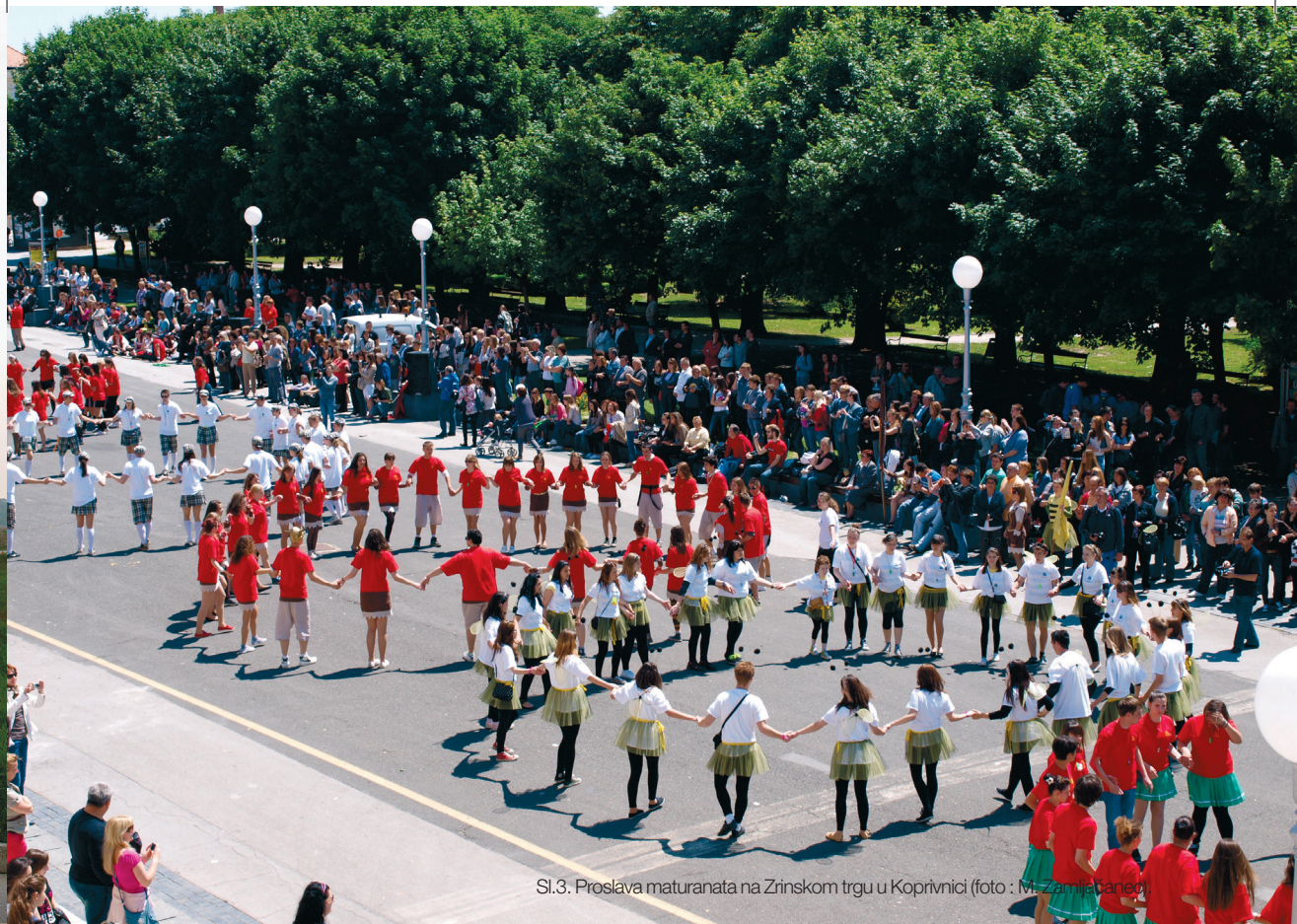
Sl.3. Proslava maturanata na Žrnskom trgu u Koprivnici