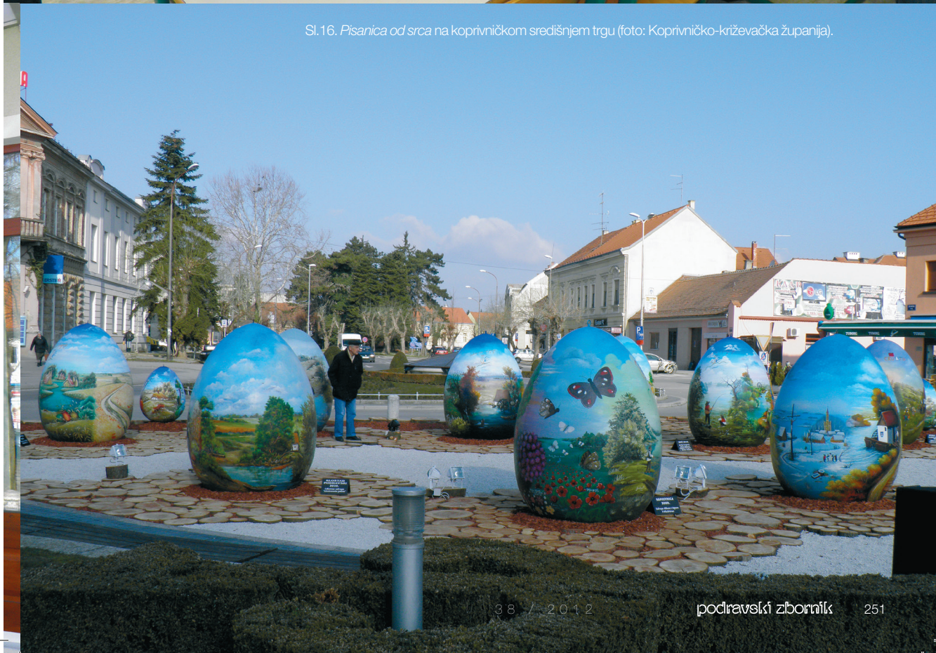
Sl.16. Pisana od srca na koprivničkom središnjem trgu.