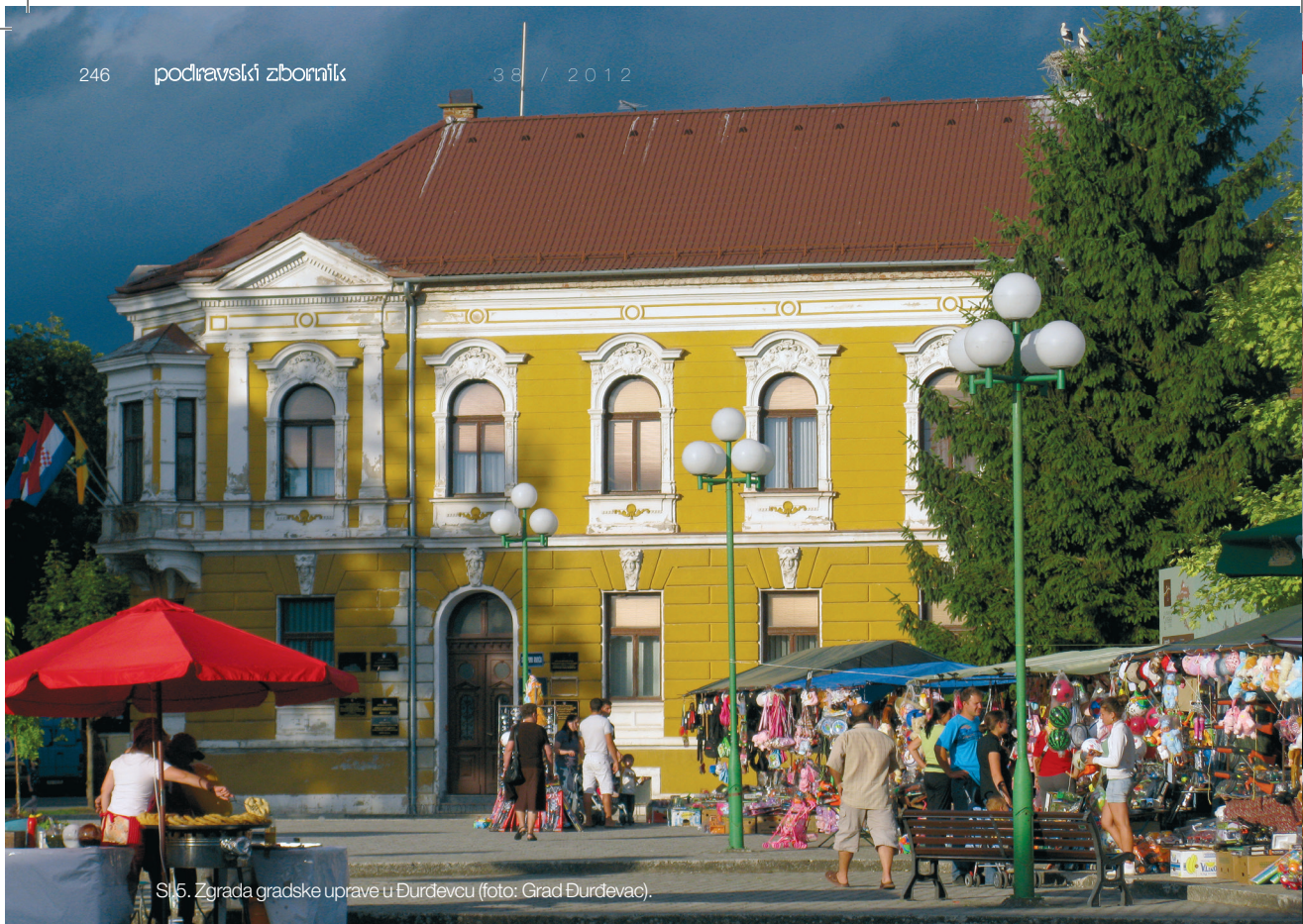
Sl.5. Zgrada gradske uprave u Đurđevcu (foto: Grad Đurđevac).