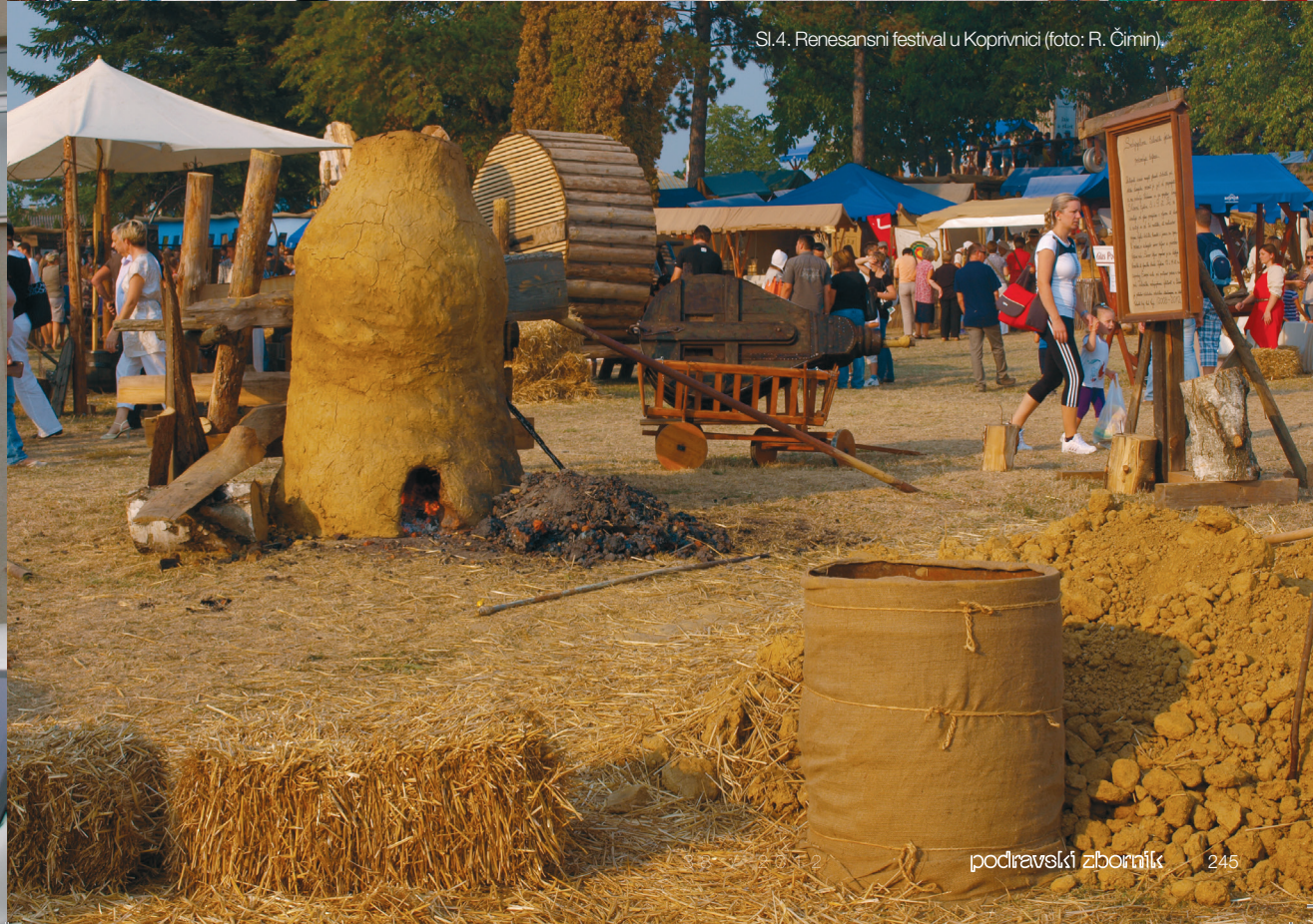
Sl.4. Renesansni festival u Koprivnici