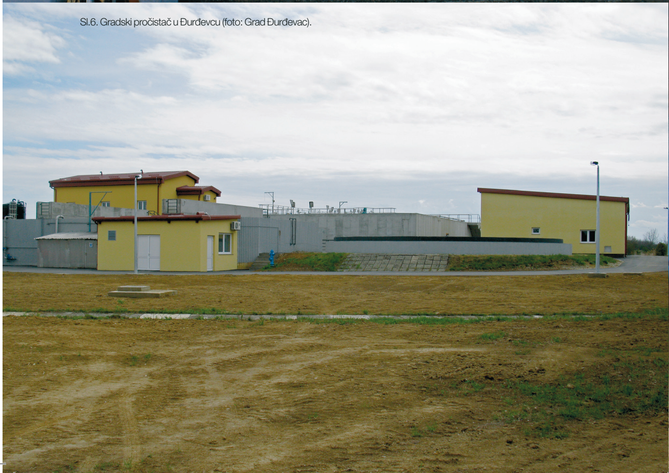
Sl.6. Gradski pročistač u Đurđevcu.