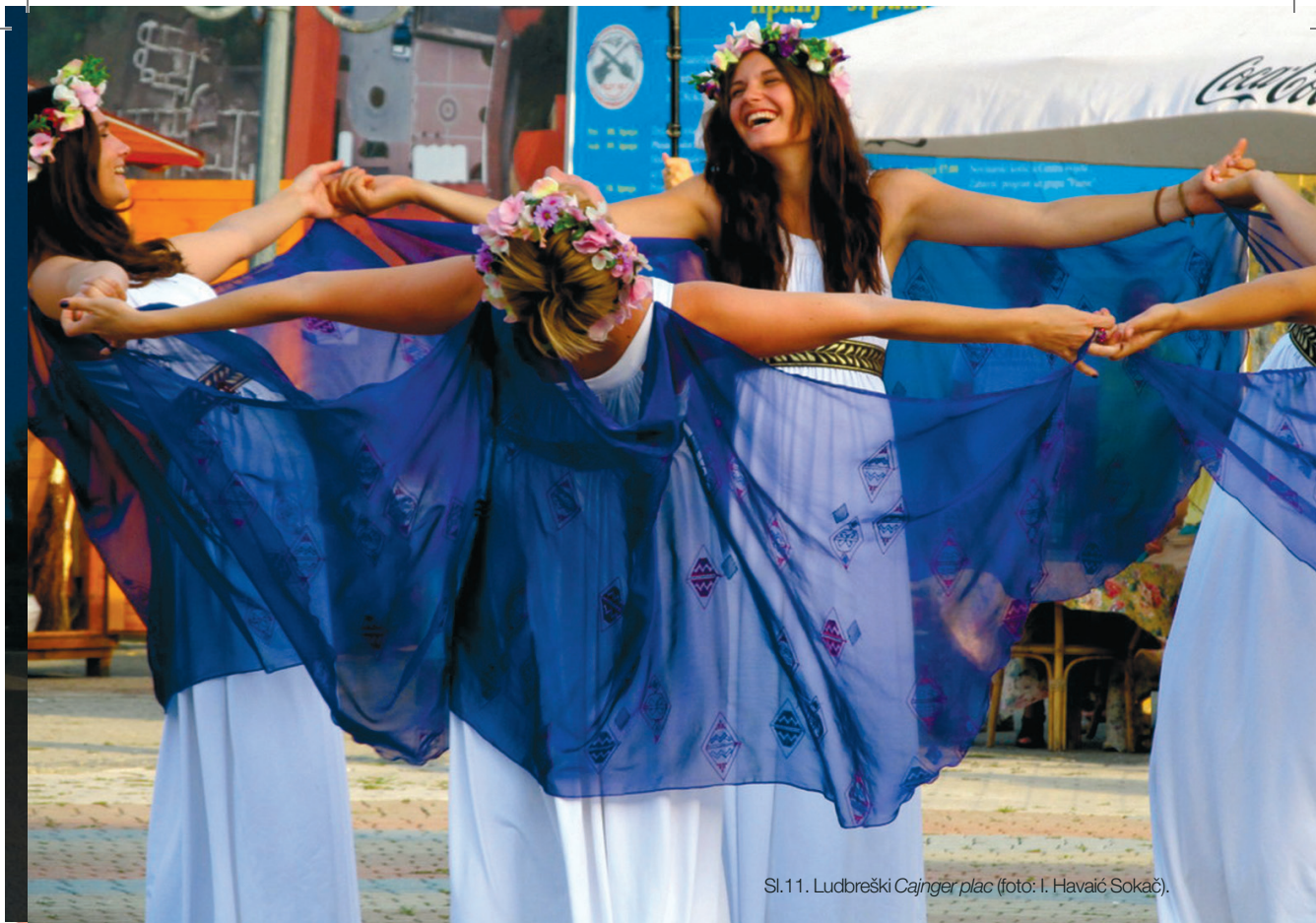
Sl.11. Ludbreški Cajnger plac (foto: I. Havaić Sokač).