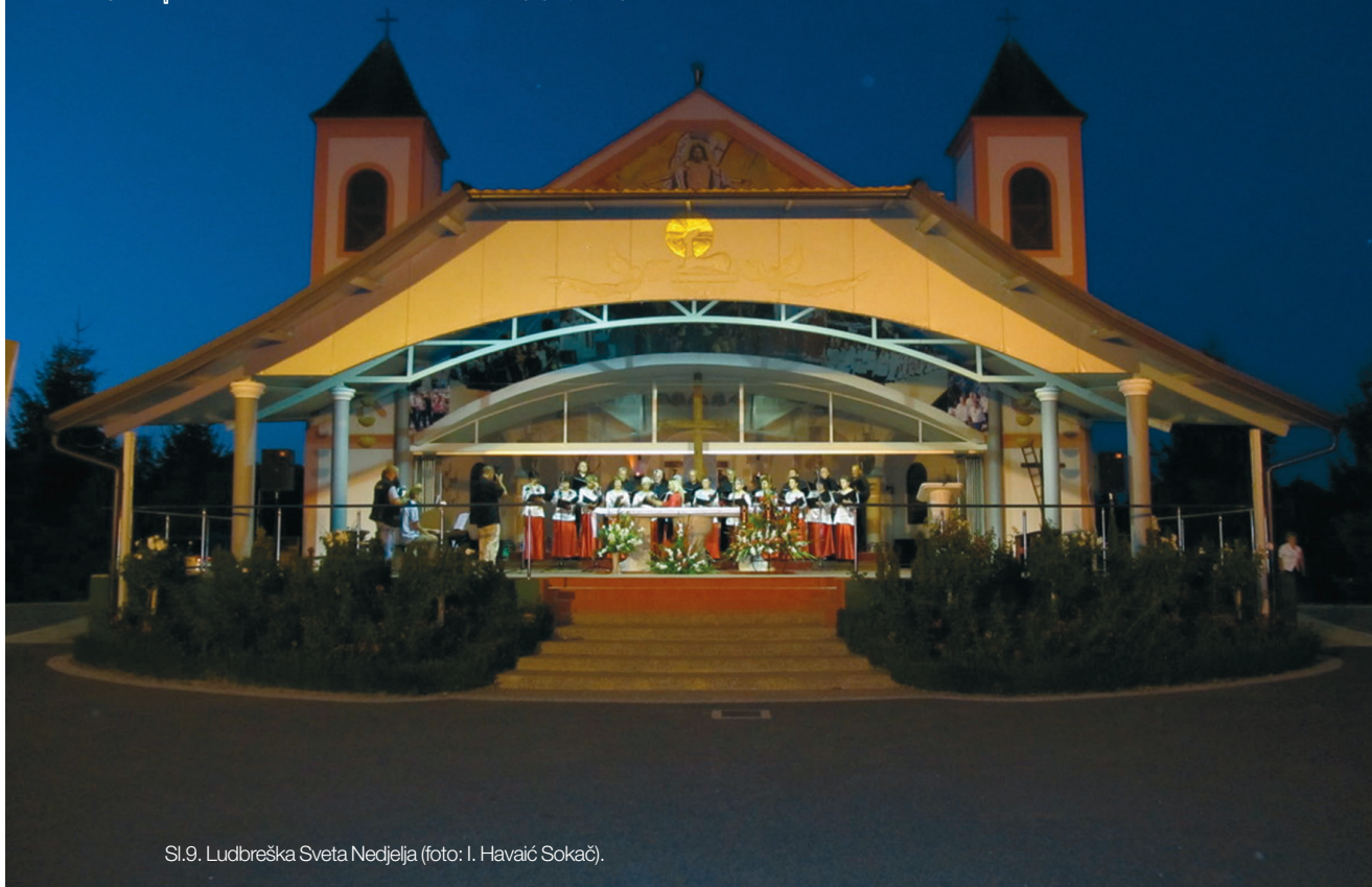
Sl.9. Ludbreška Sveta Nedjelja.