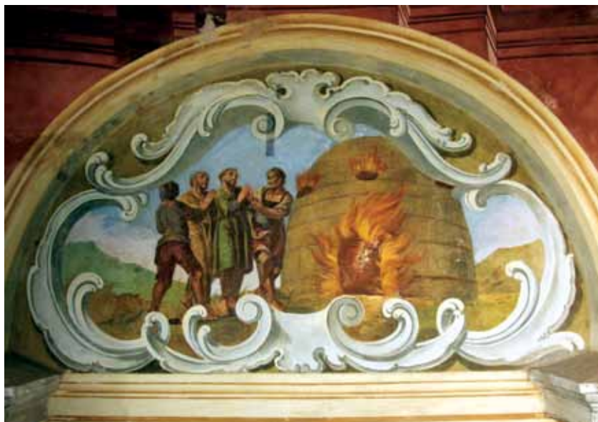
Slika 6. Zidna slika nakon čišćenja.

Tri manje preslikane zone odudarale su od ostalih većom gustoćom preslika kao i daleko težim uklanjanjem. Preslik u tim zonama nije bio vodotopljiv te je bio otporan na blaža sredstva mehaničkog čišćenja poput spužvi i gumica za brisanje. Za uklanjanje je korišten skalpel. Preslik nije bilo moguće u potpunosti ukloniti bez oštećivanja izvornog oslika pa su područja ostavljena nedočišćena. Ovi čimbenici pobudili su gore spomenutu sumnju na uporabu druge vrste veziva pri preslikavanju, no laboratorijske analize potvrdile su da je i u ovim slučajevima za vezivo korišteno isključivo vapno.