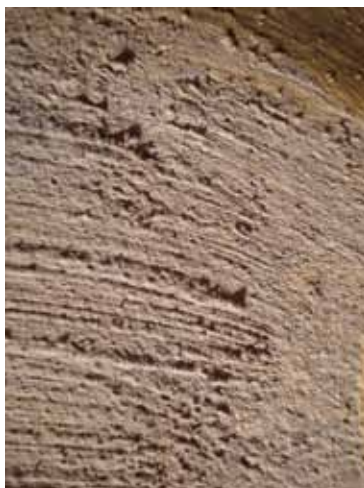
Slika 4. Tragovi "graniranja".