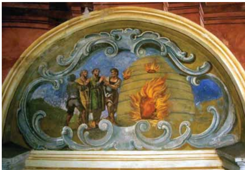
Slika 1. Zidna slika u luneti sjevernog zida pod četvrtim travejem, zatečeno stanje.

u crkvi sv. Kuzme i Damjana u Kuzmincu”. Ta se sistematična i iscrpna dokumentacija kao i plodonosna suradnja dviju institucija činila dovoljno dobrim povodom i izvorom za nastanak teksta koji slijedi - sažetog opisa konzervatorsko - restauratorskih radova na zidnoj slici iz ciklusa mučeništva sv. Kuzme i Damjana.