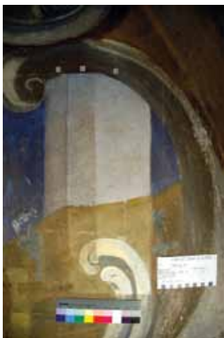
Slika 3. Proba čišćenja.