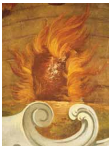
Slika 7. Detalj ognja nakon čišćenja.