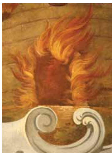
Slika 8. Detalj ognja nakon reintegracije oštećenja u slikanom sloju.