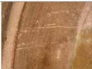
Slika 9. Dio kataloga oštećenja.