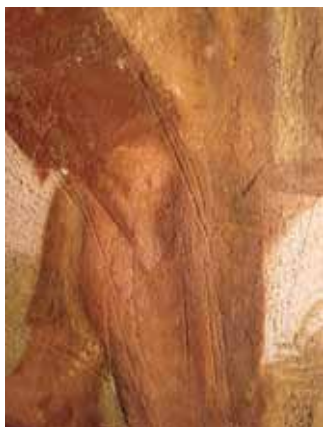
Slika 5. Urezani preparirni crtež.

Slikar je prvo postavio kompoziciju širokim ploham lokalnoga tona te je naknadno tonski modelirao volumen. Vidljivo je, osobito u slučaju likova, da su najprije nanošene guste svjetlije boje s više vapnenog mlijeka, a na njih tamnije sjene čija se dubina tona postizala razrjeđivanjem vapnenog mlijeka s vodom. To je razlog da su najtamniji smeđi tonovi najosjetljiviji i najslabije vezani za podlogu.