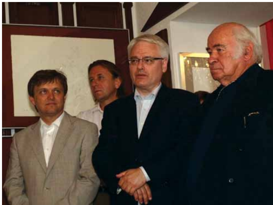
S lijeva gradonačelnik Koprivnice Zvonimir Mršić, Predsjednik Republike Hrvatske Ivo Josipović i slikar Mijo Kovačić na otvorenju izložbe crteža iz ciklusa i mape Danse macabre u svečanoj dvorani Gradske vjenčalonice na Podravskim motivima 2. srpnja 2011. godine. (snimio Zoran Stupar)