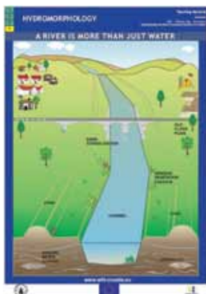
Kako EU ne VIDI svoje rijeke