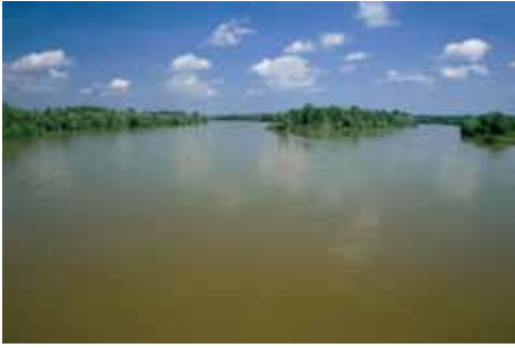
Drava kod repaškog mosta