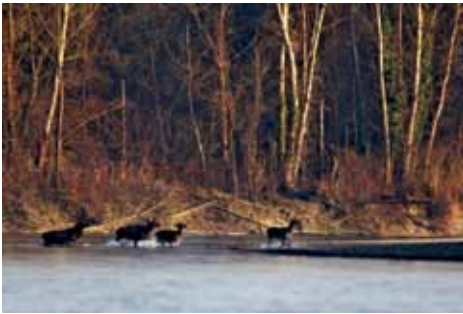
Jeleni plivaju preko Drave