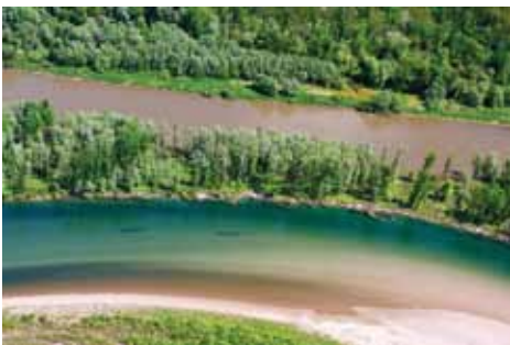
Mura i Drava teku usporedno