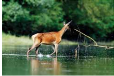
Jelen u dravskom rukavcu