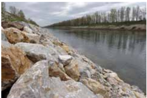
Umjetni kanal HE Donja Dubrava