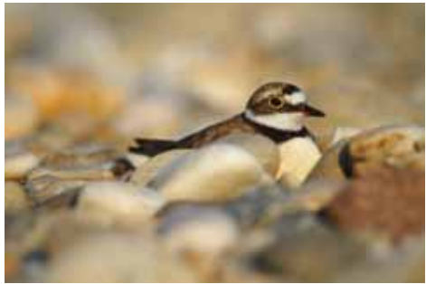
Kulik sljepčić na gnijezdu od golog šljunka