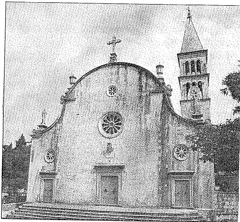
Pročelje nerežiške crkve (crkva, spomenuta na istom mjestu već u 13. st., dobila je sadašnji izgled u 18. st.)

godine Nerežišća postaju upravno središte Brača (i ostaju do 1827. godine, kad se ono premješta u obližnji Supetar). 4 Uza svu potvrđenu tisućljetnu povijest nerežiške župe, u obrađivanju ove teme došli su u obzir svećenici, redovnici i redovnice iz Nerežišća od 1400. g. do danas. To je posve razumljivo, jer prije spo-