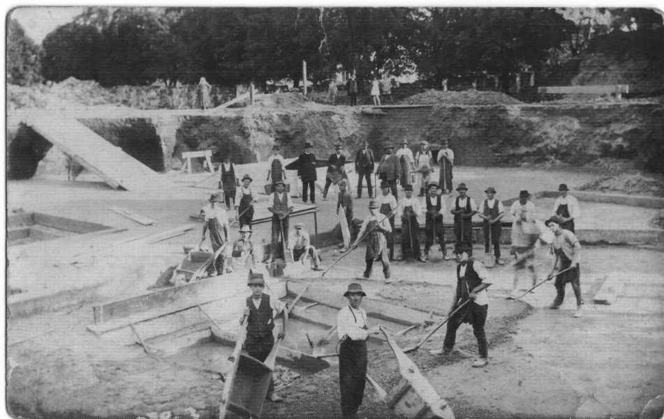
Radovi na izgradnji temelja crkve Sv. Jurija u Đurđevcu