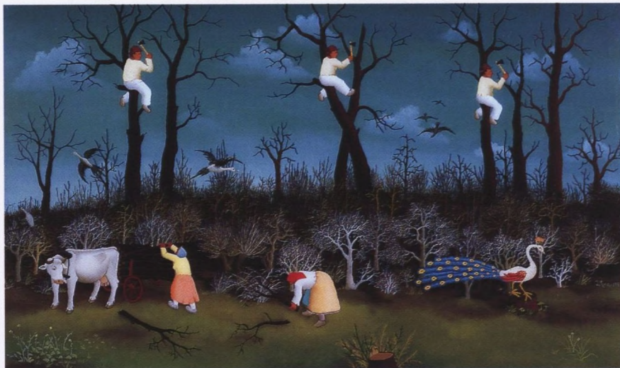
Ivan Generalić: Drvošeče, 1959.