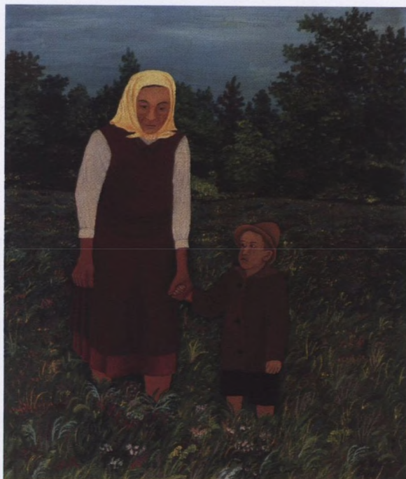
Mirko Virius: Majka i dijete / Podravka, 1939.