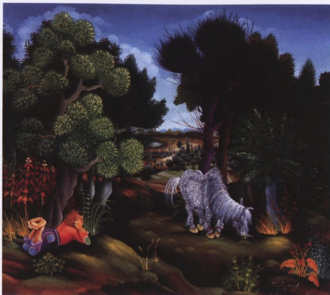
Ivan Večenaj: Kobila na paši,