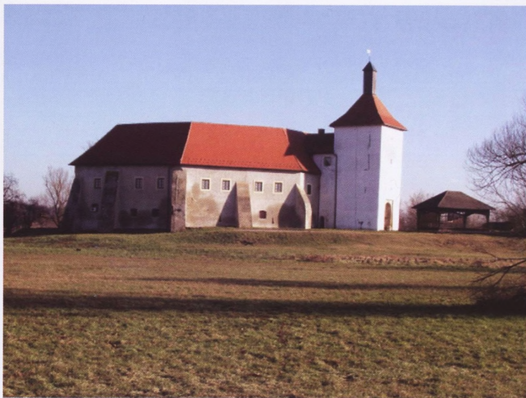
Utvrdra Stari grad, Đurđevac 2007.