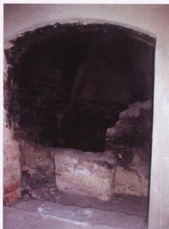
Gotički prozor u atriju, sjeverno od ulaza u dvorište