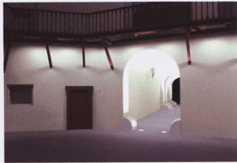
Rasvjeta atrija i veže