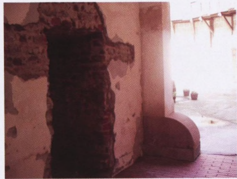
Proboj zida u veži ispod stepeništa

ju, nameće se isti problem prisutan kroz stoljeća, a to je financiranje. Sustavnija, ali ne i cjelovita istraživanja utvrde počela su 1985. godine. U razdoblju od 1985. pa do 1993. radilo se najviše na građevinskim sanacijama. Arheološkim istraživanjima obuhvaćeno je prizemlje poligonalne tvrđave, unutarnje dvorište, te prostor ispred četvrtaste kule. Zbog postojanja kuglane i ugostiteljskog objekta u istočnom dijelu tzv. vanjskog dvorišta, arheološka istraživanja u tom dijelu nisu provedena. Tada su izrađene Konzervatorska studija I i II Regionalnog zavoda za zaštitu spomenika kulture u Zagrebu. Projektna dokumentacija izrađena je u lipnju 1985., a arheološka istraživanja od strane Regionalnog zavoda za zaštitu spomenika iz Zagreba trajala su od 2. lipnja 1985. do 24. rujna 1985. s prekidima od 5.-19. kolovoza. Do danas kontinuirano kroz tri desetljeća nastavilo se s revitalizacijom utvrde. Uređenjem prizemlja krenulo se 1988. godine, nakon provedenih arheoloških istraživanja.