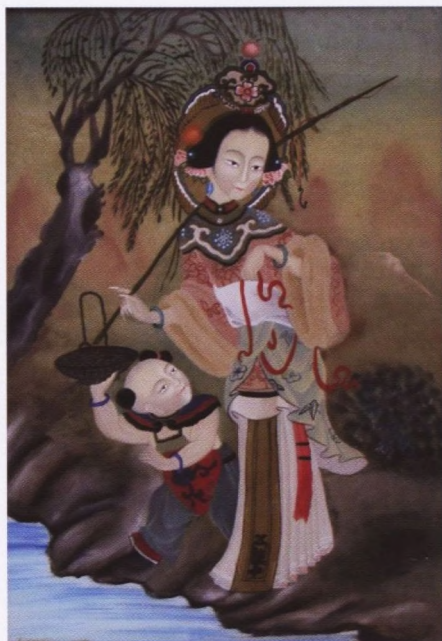
Nepoznati autor, NA POTOKU, ulje na staklu, 50 x 35

drugih životinja, ove slikarice stvorile su zanimljive dekorativne uratke za koje bismo se zakleli da smo ih već negdje vidjeli, samo se ne možemo prisjetiti gdje. Nije li to možda negdje na ovim našim prostorima ili možda negdje na indonežanskom otočju? Da nema detalja s prepoznatljivom tradicijskom arhitekturom, lampionima, odjećom ili scenskih prikaza igara sa zmajem, geografski bismo ih teško locirali. Očito je da naivna umjetnost u svijetu ima srodan likovni govor, bez obzira na brojne različitosti. Na tom tragu, a u prostoru tradicijskog i suvremenog, stoji i slikarstvo kakvo njeguje i poznata slikarica Pan Xiaoling. Među kolekcionarima ovo ime nije nepoznanica. Pouzdano se zna da u Zagrebu postoje najmanje tri manje zbirke njezinih radova. Jedna od tih je i ova Lackovićeva koji, usput rečeno, spada među najzaslužnije Hrvate za razvijenu kulturnu suradnju dviju zemalja.