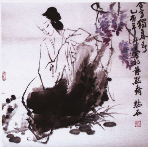
Mei Shi, MLADA KINESKINJA, tuš, 68,5 x 68,8