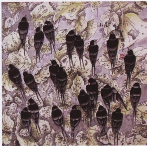
Nepoznati autor, LASTAVICE, tuš, papir, 63,4 x 64,7