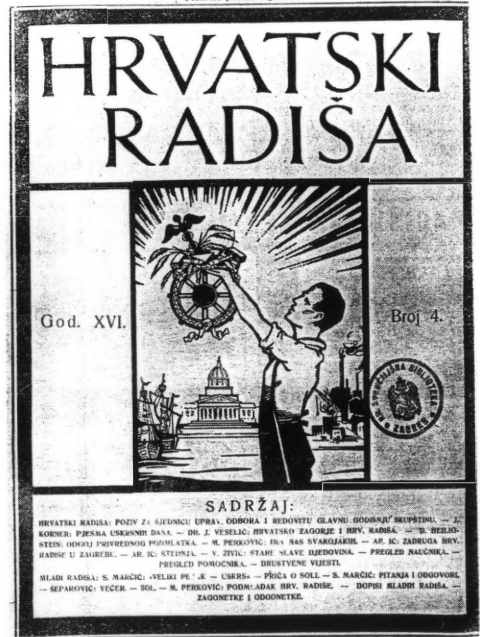
Naslovnica Hrvatskog Radiše iz 1935. u kojem su objavljeni Šeparovićevi radovi "Večer" i "Sol".