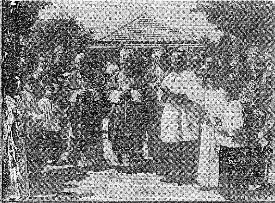
Biskup, svećenstvo (Lozić u kotu) i župljani u crkvenom dvorištu na dan blagoslova obnovljene gđinjske crkve 23. travnja 1973.

Vremenskim slijedom najstariji je govor upućen biskupu u prigodi njegova pohoda gđinjskoj župi 1971. g. Zaželio je da ga njegovi župljani dožive kao pastira i vođu, oca i učitelja. S tim u svezi je nadodao: "Ovaj teren na