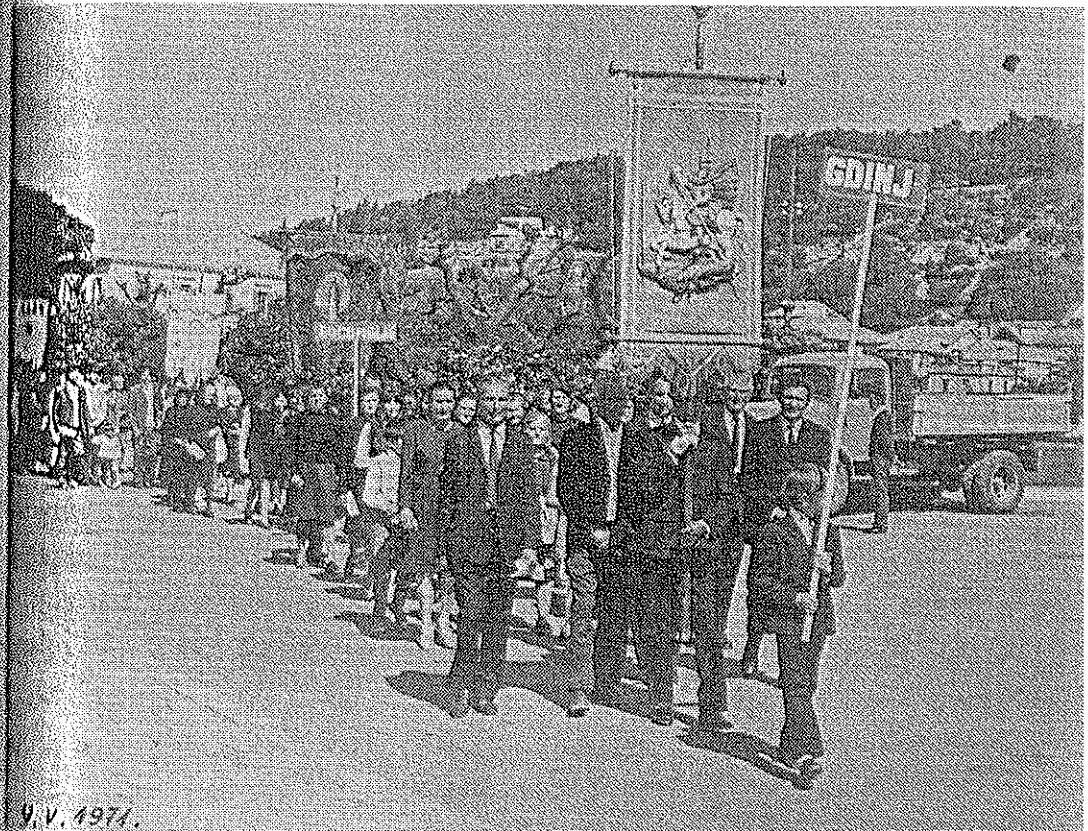
9. V. 1971.

sp. bilj. 52. a u Gdinj, prvu 11., 200,00 din) konkretnom postup