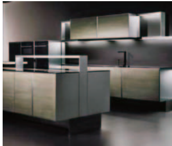
Porsche dizajn, Imm Cologne 2008.

Green Line namještaj. Namještaj proizveden od prirodnog materijala, koji se može reciklirati i na taj način zaštititi okoliš, prvorazredan je ovogodišnji hit.