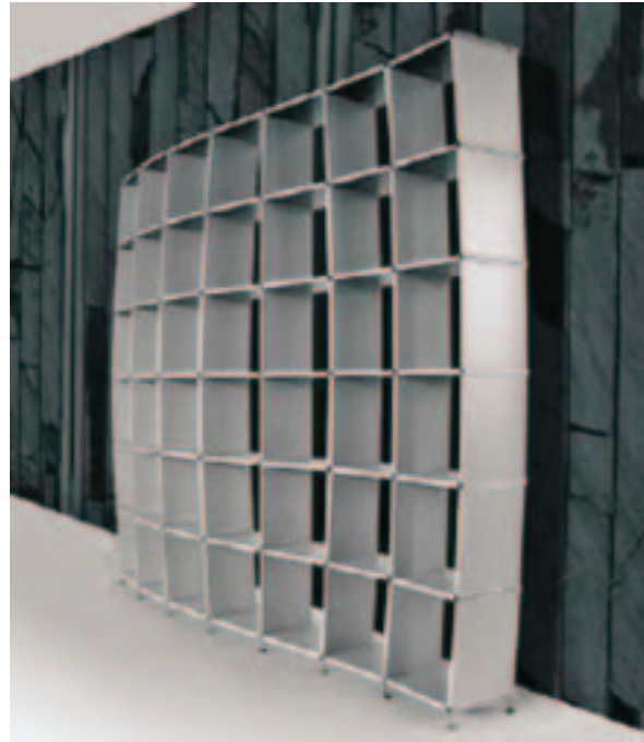
Knell dizajn, IMM Cologne 2008

Namještaj je lagan i fleksibilan. Urbane sredine sa sve većim brojem stanovnika imaju potrebu štednje prostora za stanovanje, pa mali stanovi bez ikakvih karakterističnih prostorija poput kuhinje te dnevne, spa-