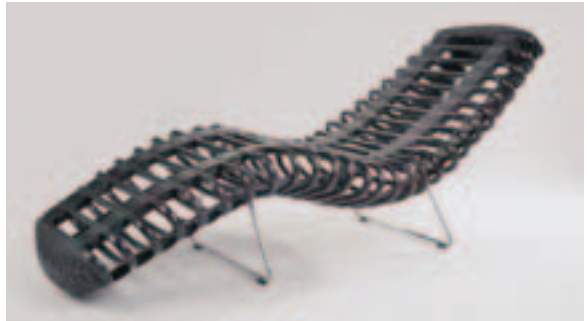
Yos Theosabrata, Imm Cologne 2008.