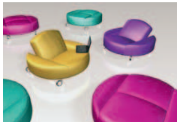
Studio Schrofer, IMM Cologne 2008

Ojastučeni namještaj ima multifunkcionalnu namjenu. Željama potrošača da iskoriste vlastitu kreativnost i varijabilno urede prostore prema svojim potrebama mogu udovoljiti domišljato dizajnirane multifunkcionalne ojastučene površine . Rješenja su često naizgled vrlo jednostavna, a nastala su zbog jasne želje krajnjih potrošača za multi-funkcionalnošću i većom fleksibilnošću. Proizvodi nisu samo mobilni i lako rastavljivi radi funkcionalnog razmještaja, već i prilagođeni upotrebi ovisno o raspoloženju korisnika.