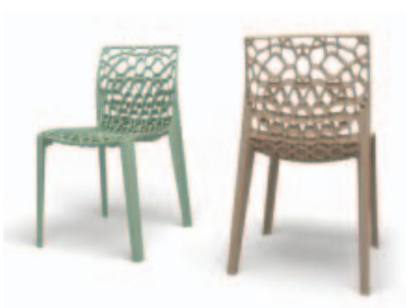
Harechair Nizozemska, IMM Cologne 2008.

omogućila pregled nacionalnih obilježja zemlje i predstavila ideju „života budućnosti“ nizozemskih arhitekata i dizajnera. Kada je riječ o dizajnu i arhitekturi, Nizozemska je trenutačno među najvažnijim svjetskim lokacijama. Naglasak je na čistom uređenju interijera, umjetničko-eksperimentalnim dodacima te samim time i kompletno novom životnom prostoru.