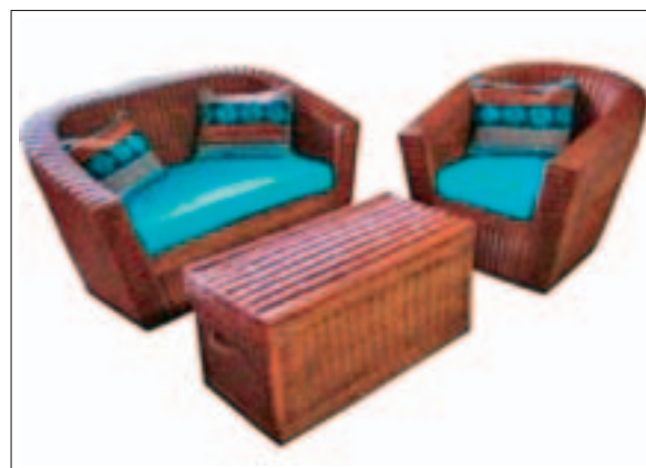
Međimurjeplet, Imm Cologne 2008.

Na ovogodišnjem sajmu Republiku Hrvatsku predstavilo je osam proizvođača: DI Sekulić, d.o.o.; DIN Novoselec, d.o.o.; Lapibus, d.o.o.; Javor, d.o.o.; Inkea, d.o.o.; Međimurjeplet, d.d.; Studio Mosaico i Drvni cluster SZH, na ukupnoj površini od 300 m 2 (paviljon 2.2-moderan namještaj; 4.1-stolice i sjedeće gar-