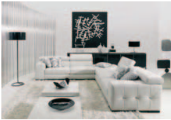
Natuzzi SpA, IMM Cologne 2008.