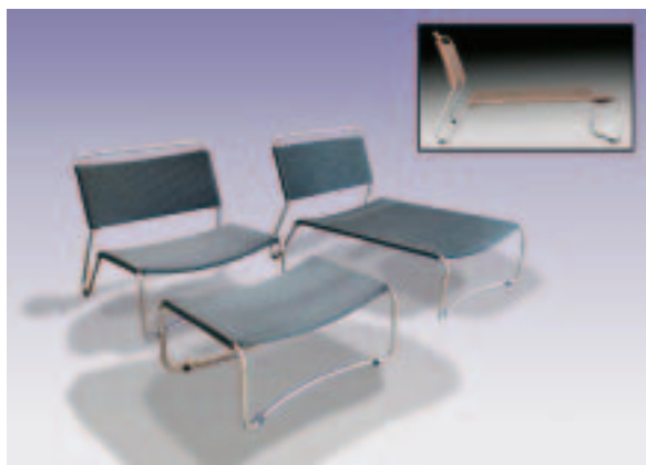
Bree's New World Nizozemska, Imm Cologne 2008.