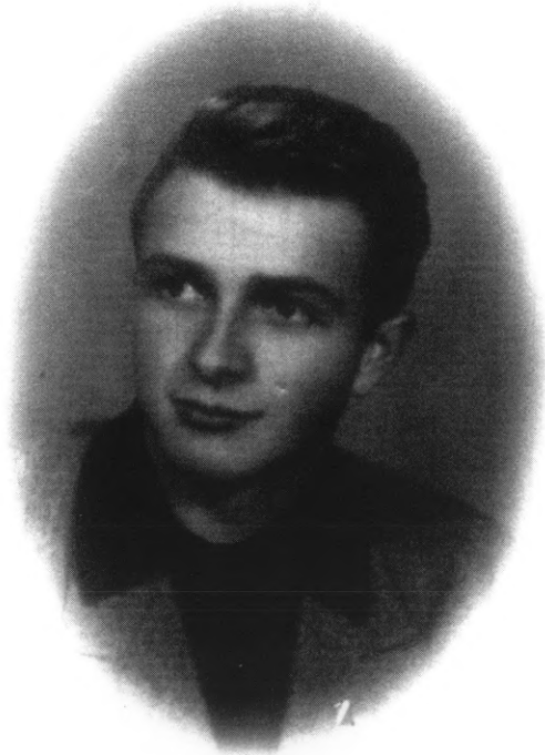
Portret iz početka 1960-ih godina.