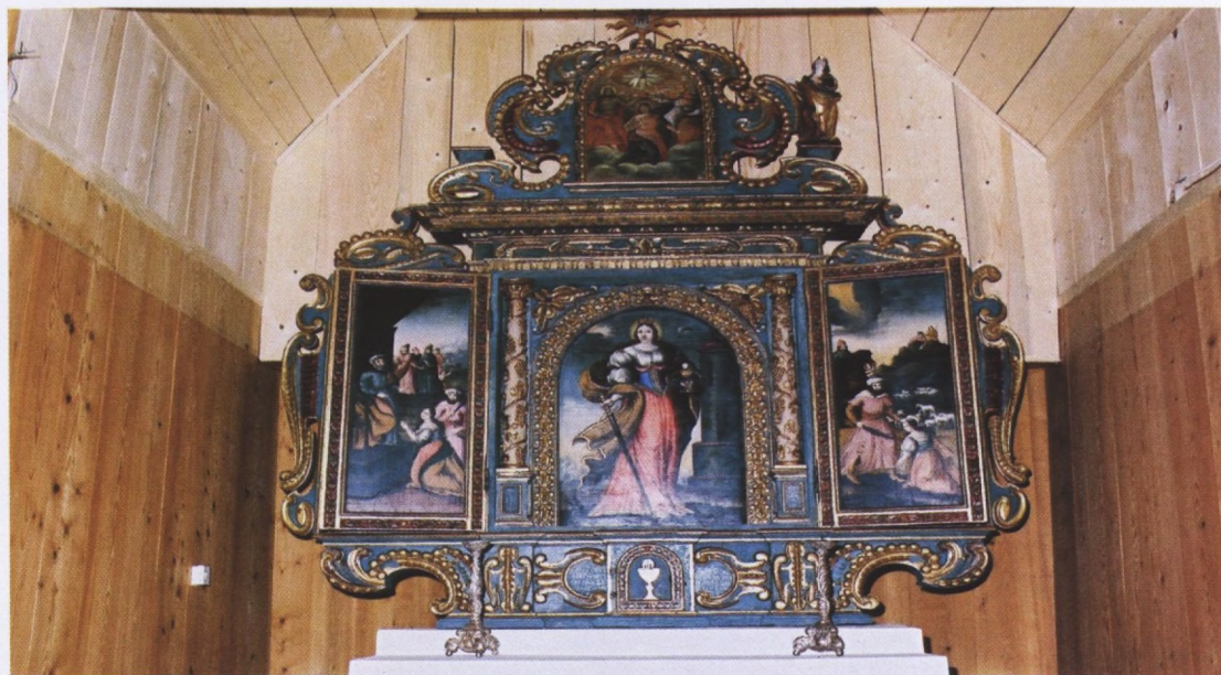
Glavni Oltar Sv. Barbare u kapeli Sv. Terezije u Brestu Pokupskom (295x 297 cm, bez monograma na vrhu atike)