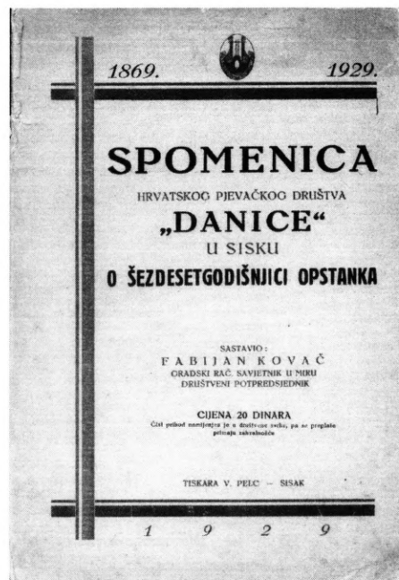
Naslovna strana Kovačeve Spomenice "Danici" (Sisak, 1929.)

U vrijeme kada je Kovač došao u Sisak grad je već dvadeset godina bio jedinstven, tj. bio je spojen građanski i Vojni Sisak. Sisak se brzo razvijao kao zadnja željeznička stanica na istoku i zadnja savska luka na zapadu s još uvijek postojećom mogućnošću plovidbe Kupom. No željeznica je poništila planove o njegovanju riječnih putova u Hrvatskoj, pa je i Zagrebu u tom vremenu već odustao od izgradnje svoje luke usprkos plovnosti Save do Ivanje rijeke.