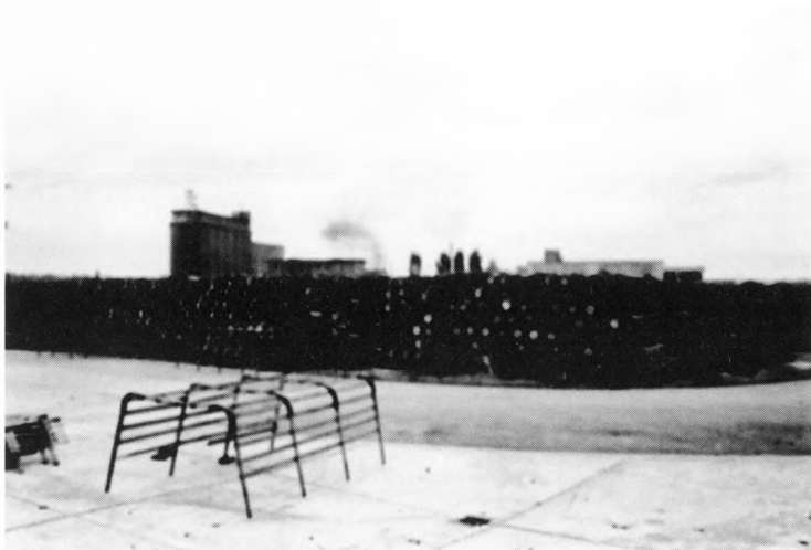
Bačve u kojima se čuvalo voće za proizvodnju marmelade i džemova Podravka, iz tvorničkog kruga Podravke, polovica 50-tih godina 20. stoljeća, (Snimio Ivan Šef, fototeka Muzeja grada Koprivnice)

je ta garancija trebala važiti sve do kraja 1981. godine.