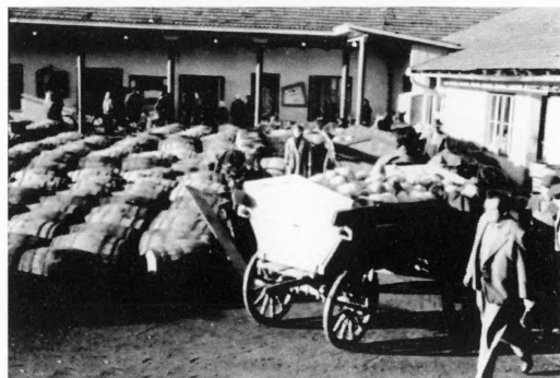
Doprema sirovine iz podravskih sela u tvornički krug Podravke