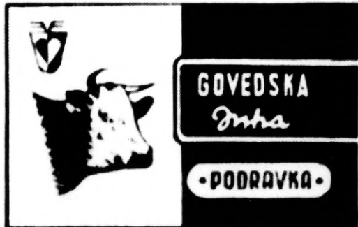
Novi Podravkini proizvodi, oko 1960. godine

u iznosu od 80 milijuna dinara za pokriće tekućih gubitaka, koji su bili predviđeni u godišnjoj visini od 85 milijuna, a u prvih su osam mjeseci već dosegli 73,3 milijuna dinara.