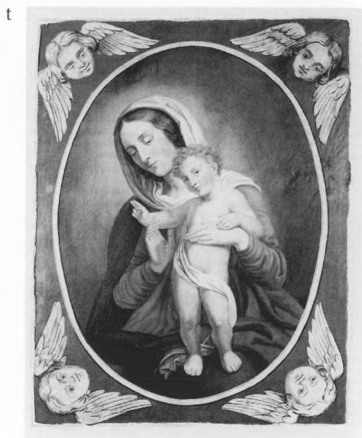
Slika bogorodice prije i poslije restauracije

ojanost boje radi mokrog postupka čišćenja. Probama je utvrđeno da je boja slabo postojana, a dobre rezultate ponovno je pokazala otopina alkohola. Zastava je ušivena između dva sloja tila, te je na posebno pripremljenom, ukošenom stolu proveden postupak mokrog čišćenja. Površina tkanine zatim je prosušena i izravnata pomoću staklenih utega. S obzirom na stupanj oštećenja svilenog damasta, provedena je parcijalna sanacija oštećenja podljepljivanjem. Podljepljena je krepelin svilom obojanom u odgovarajućem tonu na koju je predhodno nanijeto reverzibilno ljepilo. Krepelin svila termički je učvršćena za svileni damast nakon čega je dodatno učvršćena šivanjem, svilenim filamentom u odgovarajućem tonu, konzervatorskim bodom. 9