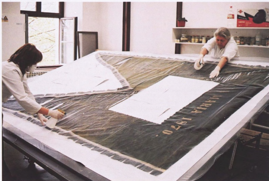
Mokro čišćenje zastave

Nakon suhog postupka čišćenja svilenog damasta, također su napravljene probe na pos-