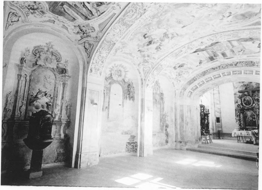
Ambijent dvorske kapele Sv. Križa