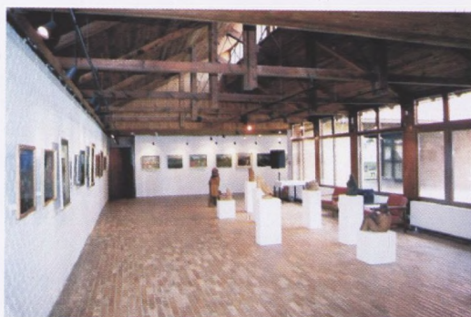
Galerija naivne umjetnosti Hlebine, izložbena dvorana s ostakljenim zidom prema atriju