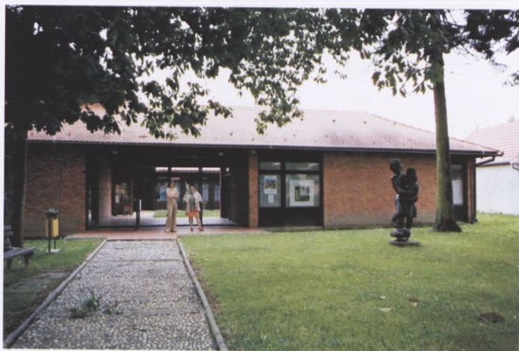
Galerija naivne umjetnosti Hlebine, ulazno pročelje, snimio Ž. Laszlo, 2005.g.