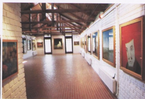
Galerija naivne umjetnosti Hlebine, izložbena dvorana, slike vise iznad radijatora i gotovo su posve priljubljene uz zid