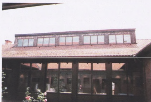
Galerija naivne umjetnosti Hlebine, prozori u krovu koji dodatno osvjetljavaju unutrašnjost izložbene dvorane