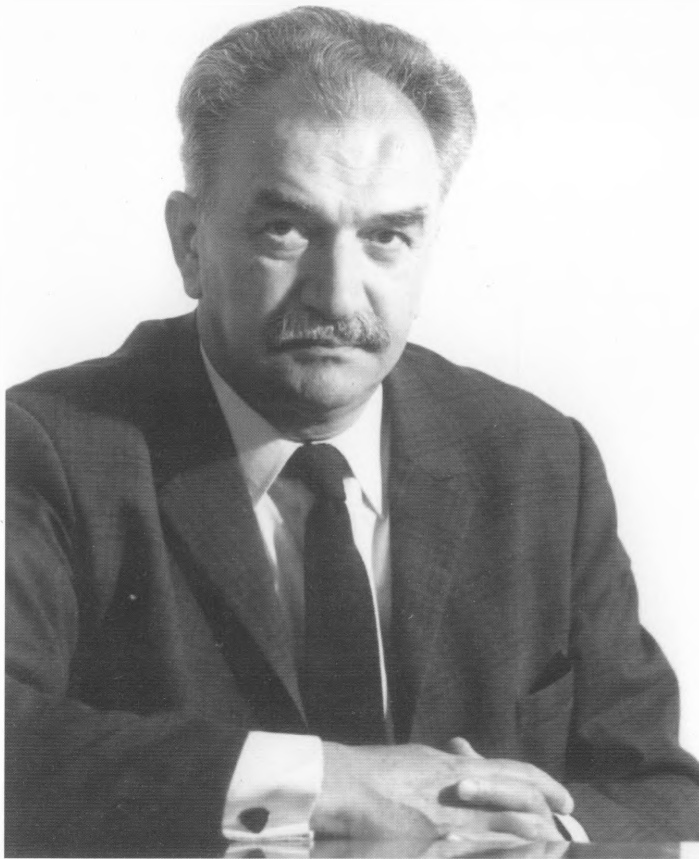
Profesor Vlado Mađarić, (Ludbreg, 12. svibnja 1915. - Zagreb, 27. ožujka 1985.)