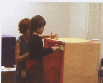
5. - 8. Radionica etno kutija