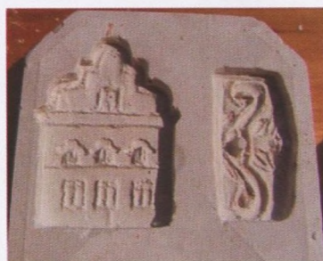
9. - 14. Radionica figurica s magnetičima - stikersi