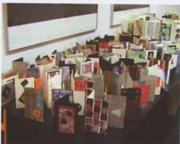
1. - 4. Radionica božićnih čestitki