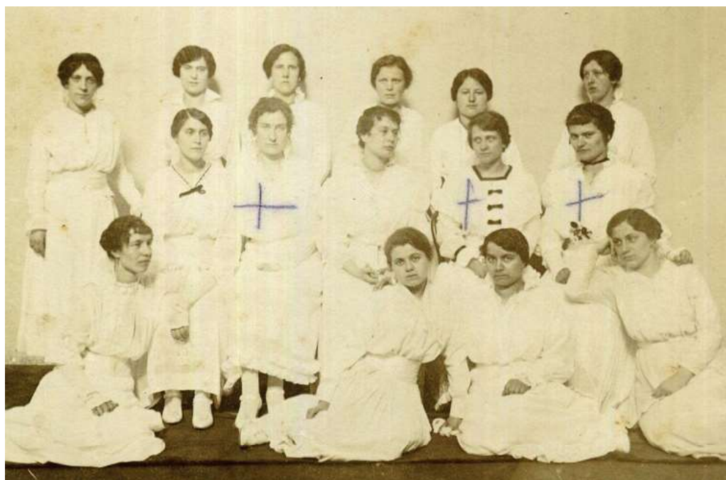
Pazin, 1916., Prve preparandice pazinske Učiteljske škole (legendirao Tugomil Ujčić)