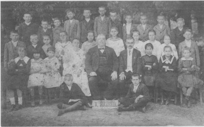
Viša građanska škola, 5. razred.