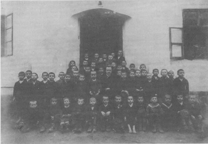
Dječaki razred niže građanske škole.