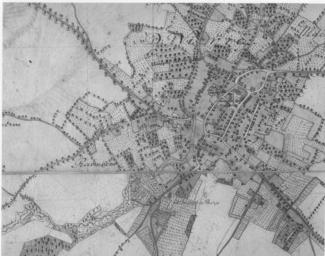
Slika 1. Virje na jozefinskom planu iz 1783. godine