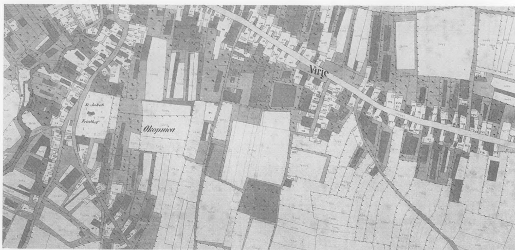
Slika 2. Južni dio Virja na katastarskom planu iz 1869. godine