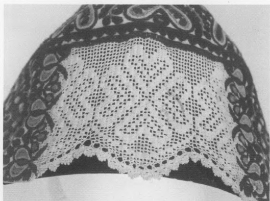
Slika 4. Detalj poculice: prednje "špice" izrađene tehnikom na kukicu. Foto: V. B. Vučković, 2003.