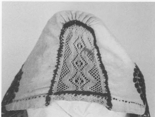
Slika 3. Detalj poculice: halovec izveden tehnikom jalbe. Foto: V. B. Vučković, 2003.