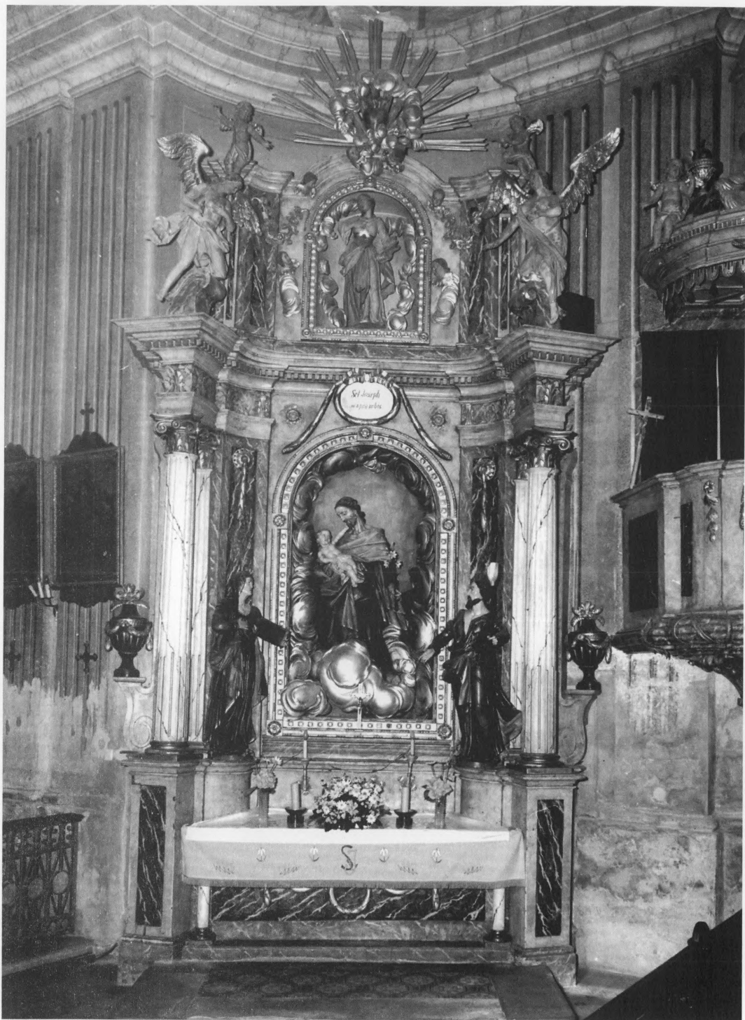
1. Oltar sv. Josipa