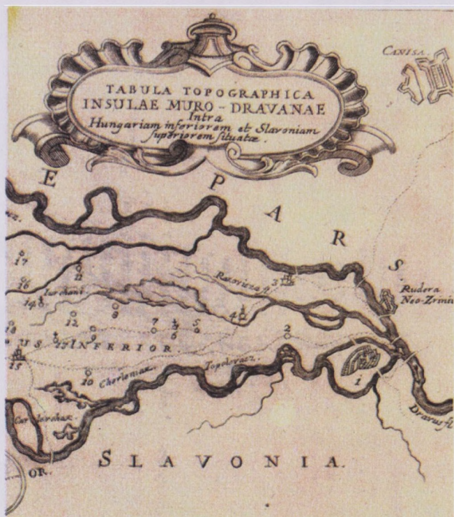
5. Legrad na karti Međimurja Josipa Bedekovića, 1752. (označen brojem 1) 6. Legrad na katastarskom planu, 1859.