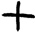
Protokananejski 1300/1200 pr. Kr.