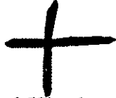
Serabit el Khadem. Sinaj. Protokananejski 1500. pr. Kr.