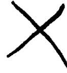
Hebrejski pečat. VII. st. pr. Kr.