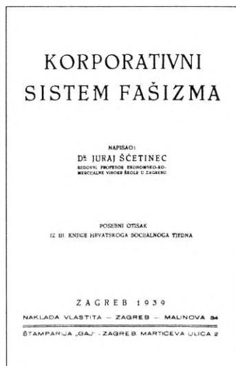
2. Naslovna stranica knjige "Obrtničko pitanje", Zagreb, 1926.; 3. Naslovna stranica prve knjige Hrvatskog socijalnog tjedna, 1937.; 4. Naslovna stranica knjige "Korporativni sistem fašizma", objavljene 1939. u vlastitoj nakladi.

Radničkoj komori. Već 1932. izabran je za docenta za predmet "Sociologija" i "Socijalna politika" na istom Fakultetu, a onda je osnovao i Zavod za socijalne odnose. U to vrijeme pada njegov prvi angažman na organiziranju predavanja u okviru prvog Hrvatskog socijalnog tjedna. 1932. godine, a u jeku kulminacije velike svjetske krize, svi su slojevi društva tražili izlaz iz krize. Sastanke su organizirali ekonomisti, sociolozi, pravnici, socijaldemokrati, vlada. Tečaj socijalnih predavanja održan u Zagrebu od 4. do 10. prosinca 1932. kasnije se uzima kao Prvo zasjedanje Hrvatskog socijalnog tjedna s time da je 1937. organizirano drugo, a 1938. treće zasjedanje.