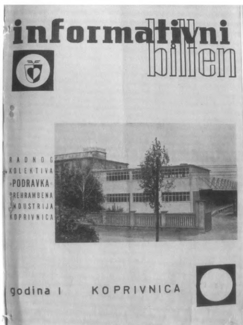
1. Naslovnica prvog broja Podravkinog tvorničkog lista, 28. studeni 1962.

ta u raznim prigodama pretiskanom, šalom pod nazivom "Naučni radovi": "U hali B vršit će se ove zime važna naučna ispitivanja o korisnom utjecaju niskih temperatura na ljudski organizam."