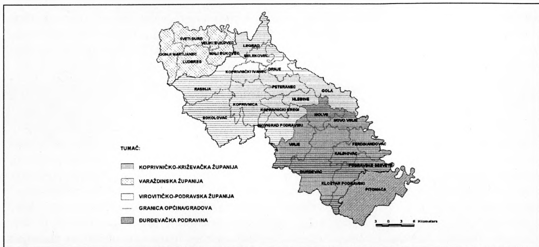
Karta 1: Upravno - teritorijalno ustrojstvo Podravine (stanje 2001.godine)