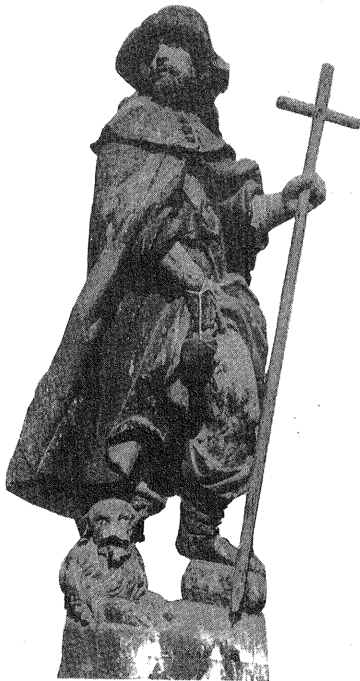
Kip sv. Roka (poč. 17. st.).