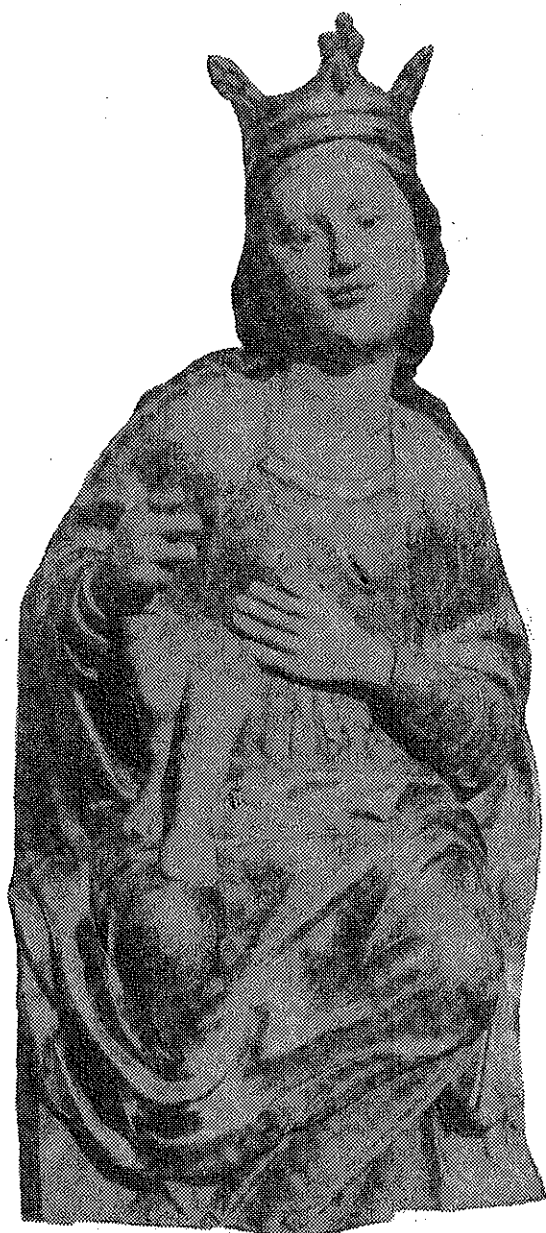
Kip Gospe od Utišenja (oko 1500.g.)