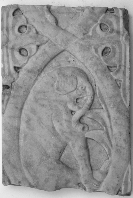
Ulomak pluteja iz Daruvara, 11. st., Gradski muzej Bjelovar

liježu diktatu suvremenih teritorijalno-političkih struktura. Konačno, može se reći da odabrani teritorij približno odgovara dvjema kasnoantičkim provincijama formiranim u južnoj Panoniji: Pannonia Savia i Pannonia Secunda .