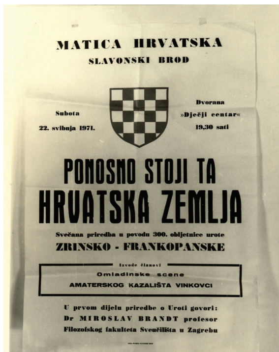
Slika 3. Matica hrvatska SlavonSKI Brod oglašava priredbu povodom 300. obljetnice Zrinsko-frankopanske urote u sklopu koje je govor održao i Miroslav Brandt.