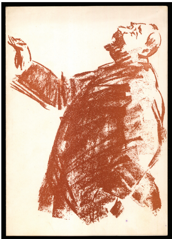
Slika 7. Naslovnica pozivnice na svečanu akademiju povodom obljetnice rođenja Stjepana Radić.