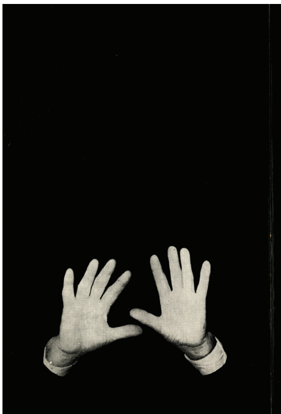
Slika 1. Poledina knjige Zvonimira Kulundžića Tragedija hrvatske historiografije: o falsifikatorima, birokratima, negatorima, itd...itd... hrvatske povijesti koja je u vlastitoj nakladi autora izašla 1970. godine.

ja šezdesetih do kraja 1971. prošla zaista široku razvojnu i idejnu putanju, tada kazala: „[K]ako to da mladi ljudi bez obzira sad na to koji njihov dio, idu za parolama 19. stoljeća. I ja sam [...] vrlo često pri svom radu bila impresionirana i potresena činjenicom da kad vidimo što kažu [...], ideolozi XIX. stoljeća, da takav isti osjećaj nalazim danas sto godina kasnije. Tu nešto ipak nije u redu. [...] Oni, dapače, ako nađu neko lice u XIX. stoljeću koje misle kao što oni danas misle, onda se to njima sviđa, oni ne vide da je to zapravo jedna određena zaostalost.” 118