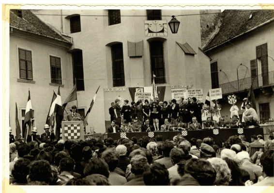
Slika 2. Osnivačka skupština Matice hrvatske u Valpovu (4. travnja 1971.).