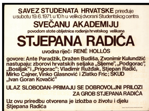
Slika 6. Plakat za svečanu akademiju povodom obljetnice rođenja Stjepana Radića.